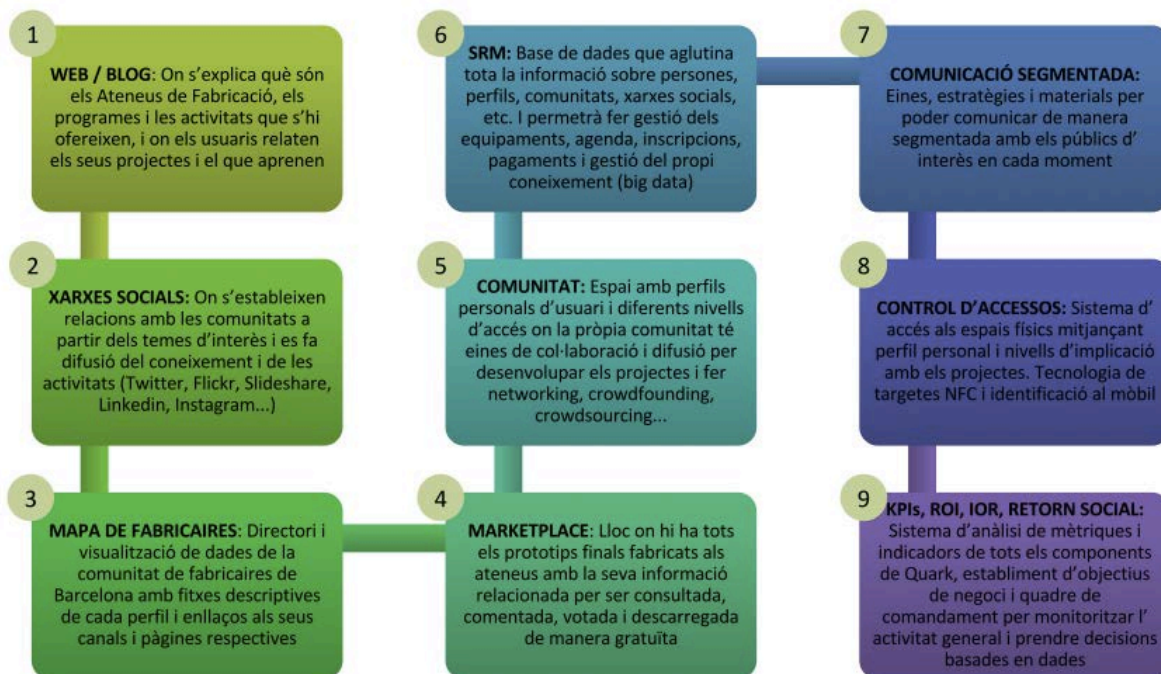
Gràfic 1. Components de QUARK

En el gràfic número 1 s'enumeren els diferents components o projectes que componen l'ecosistema de gestió oberta de coneixement Quark.