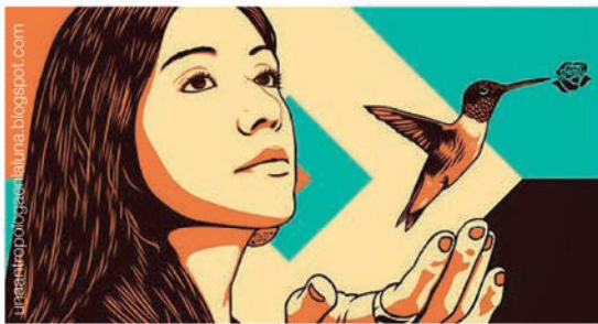
Espai Francesca Bonnemaison (c. Sant Pere Més Baix, 7)