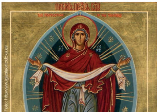
Església ortodoxa Protecció de la Mare de Déu (c. Aragó, 181)