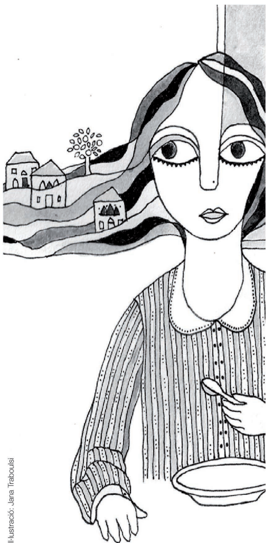
Il·lustració: Jana Trabolisi

Ens trobarem a l'Institut Europeu de la Mediterrània, IEMed (c. Girona, 20)