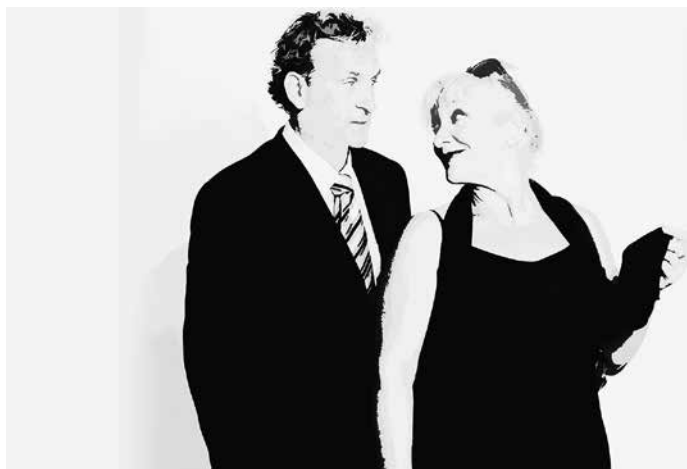
Fotografia: Sin palabras