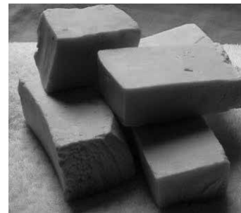
Fotografia: Los jabones de Luna

Aprenderàs a elaborar el teu propi sabó de Marsella per rentar la roba, com el feien les nostres àvies, amb oli reciclat, i també faràs un altre amb oli d'alvocat i mantega de karité.