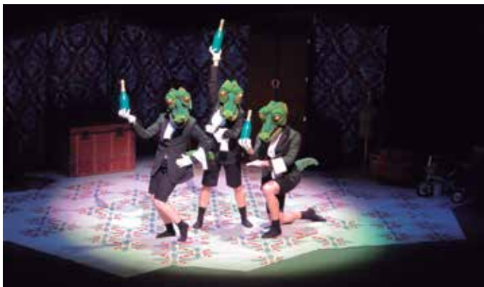
Fotografia d'Art Estudi