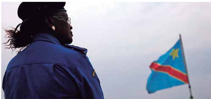
Fotograma "Maman Colonelle"