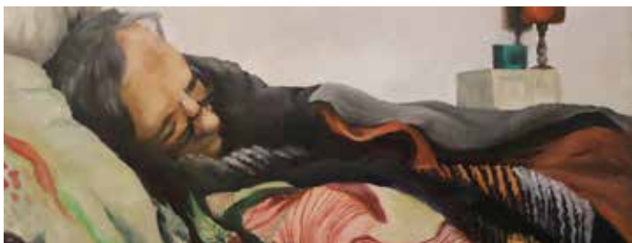
Obra de Virginia Zimanás