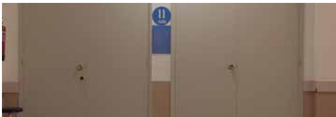
Fotografia de Zenaida Reyes

Nou estudiants de fotografia i vídeo exploren els límits de l'audiovisual, compartint com a punt en comú l'espai de creació i recerca durant un quadrimestre. Aula 11 recull diferents línies de treball, el context del qual serveix com a unificador de tot un corrent de situacions que preocupen la creació contemporània, entorn la imatge.