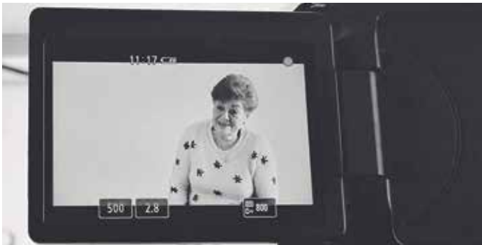
Fotograma "Evas i Adanes"