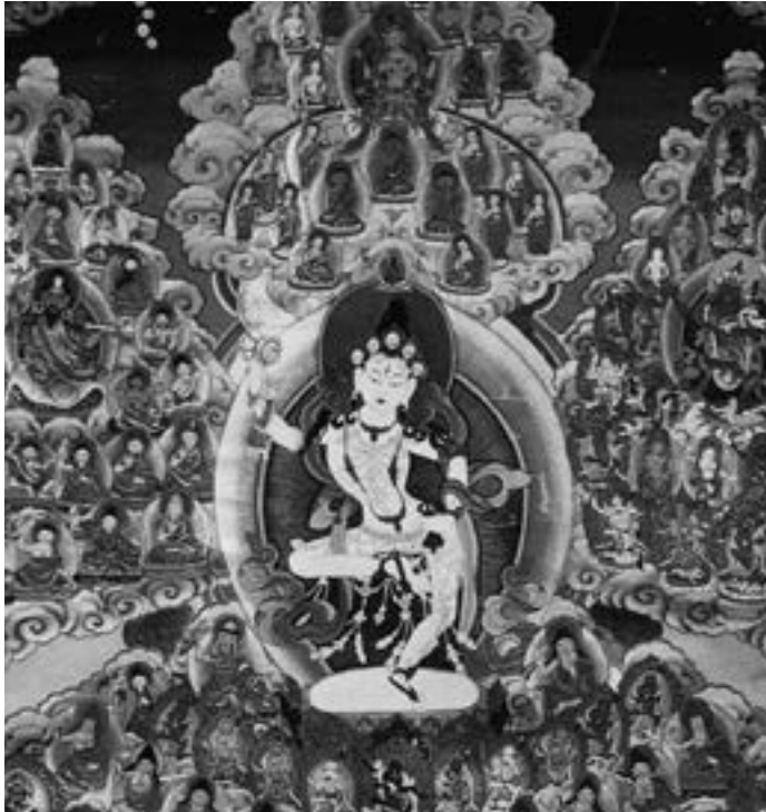
Fotografia: Tibetan Art

A càrrec de: Ferran Mestanza, Llicenciat en Llengües, Lletres y Literatura Estrangeres, especialitat Tibetana.