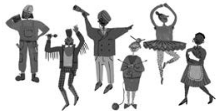
Il·lustració: Marina Sáez

A càrrec de: Marina Sáez, arquitecte i il·lustradora, educadora del lleure.