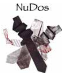
Disseny de David G. Llop

“Aparences, miratges, coses que semblen ser i no són. La vida està plena de contradiccions i enganys. Depenem de disfresses i màscares que ens imposem constantment. A NuDos, aquests cobren vida per portar-nos a través dels enganys que només podem descobrir destripant el nostre propi ésser, deslligant nusos i obrint un camí per tornar a l'origen de cadascú de nosaltres i allà, reconèixer-nos”.