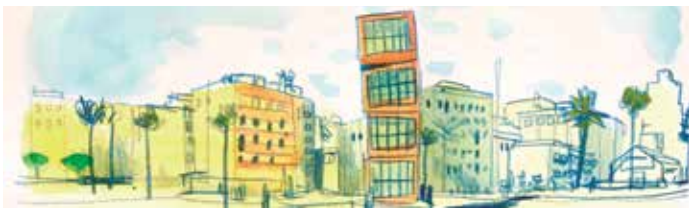
Dibuix de Victor Swasky

El vestíbul del Centre Cívic Barceloneta acollirà una mostra de treballs en procés del taller -organitzat per Urban Sketchers- Water Marks , amb dibuixos ràpids realitzats al barri del 25 al 28 d'abril.