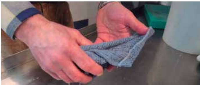
Fotografia d’Omar Addoum

Un projecte educatiu en col·laboració entre l’artista Guillem Roig, el CC Barceloneta i l’Institut Joan Salvat-Papasseit, que utilitza la fotografia i la creativitat per dotar de sentit crític als alumnes a través d’un anàlisi de la transformació social i urbanística del barri de La Barceloneta.