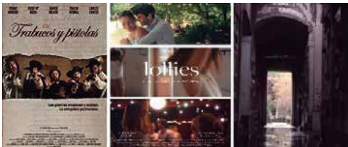
Cartells de la Mostra

Tres joves directors establerts a Barcelona presenten els seus treballs: Trabucos i Pistoles ens traslladarà a les millors ficcions d'època; Lollies ens delectarà amb la seva narració basada al món del Swing, mentre que Veus Presents és un documental esquinçador.