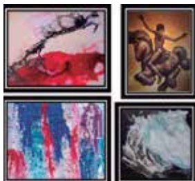
Obres dels artistes de l'exposició