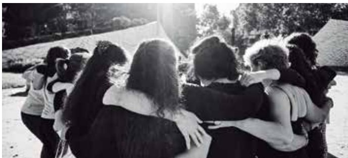
Fotografia d’Antonio Amador

Fotògraf i realitzadora: Antonio Amador Camargo i Ingrid Guyon