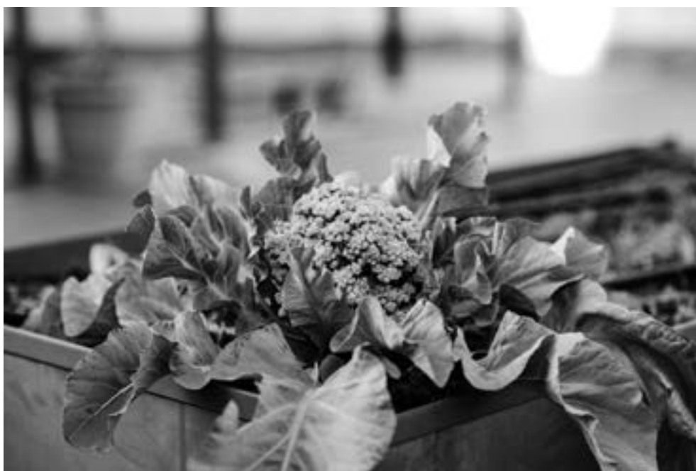
Fotografia: Jofre Moreno