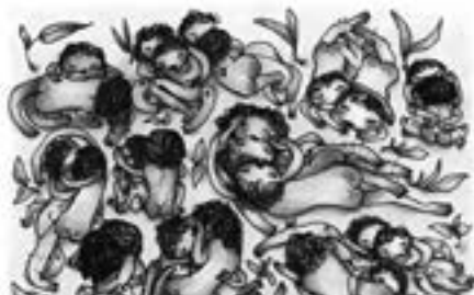
Fotografia: Eloisa Alquati

Bees and Butterflies és el nom del projecte d'il·lustració eròtica de l'artista Eloisa Alquati. Eloisa dibuixa amb totes dues mans, encara que la seva mà habitual sigui la dreta. Li encanta embrutar-se amb colors i jugar sense pensar. Li és igual la forma, només vol divertir-se i el seu passatemps preferit és fer gargots eròtics, il·lustracions que gairebé semblin traçades per la mà d'un infant, si no fos per alguns "detalls". En la infància estem lliures de judicis i plens d'imaginació. L'Eloisa vol tractar el sexe tornant a aquella mateixa frescor i transmetre una mirada innocent sobre l'amor, les relacions i la sexualitat. És una mirada lliure i oberta a les diferències, però respectuosa al mateix temps, divertida i tendra, sense malícia, judicis ni tabús.