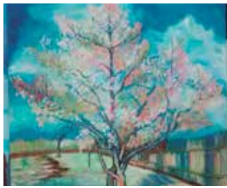
Obra de Manel Vergè

87ena exposició del Grup de Pintors de la Barceloneta on mostraran diferents temes i tècniques: oli, acrílic, pirogravat, aquarel·la, biomecànica i dibuix.