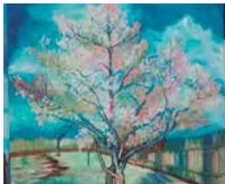
Obra de Manel Vergè

87ena exposició del Grup de Pintors de la Barceloneta on mostraran diferents temes i tècniques: oli, acrílic, pirogravat, aquarel·la, biomecànica i dibuix.