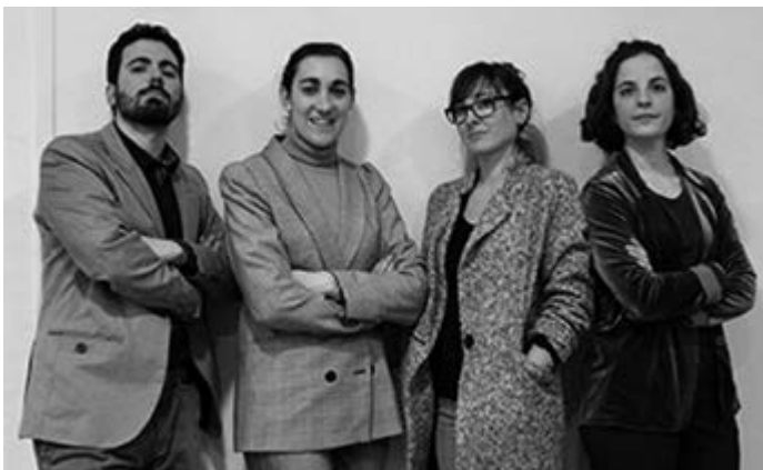
Fotografia: Les Ramones

Agraïments: Bar Coyote, CC Drassanes i CC Navas.