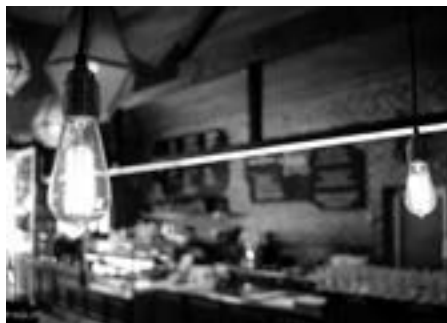
Fotografia: Carregat d'energia

En qualsevol empresa es porta gestió de magatzem, de vendes, d'administració, etcètera. Amb això s'aconsegueix tenir controlades les diferents facetes i poder prendre decisions de manera encertada. Per què no fer una gestió també del consum energètic? En aquest taller descobrirem si teniu la tarifa més reduïda per les vostres necessitats, com fer un ús eficient de determinats aparells i els aspectes que cal tenir en compte per fer un diagnòstic i una gestió energètica adequada del vostre negoci.