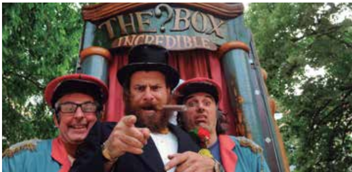
Fotografia de Cia. La Tal

Espectacle programat en el marc de Districte Cultural