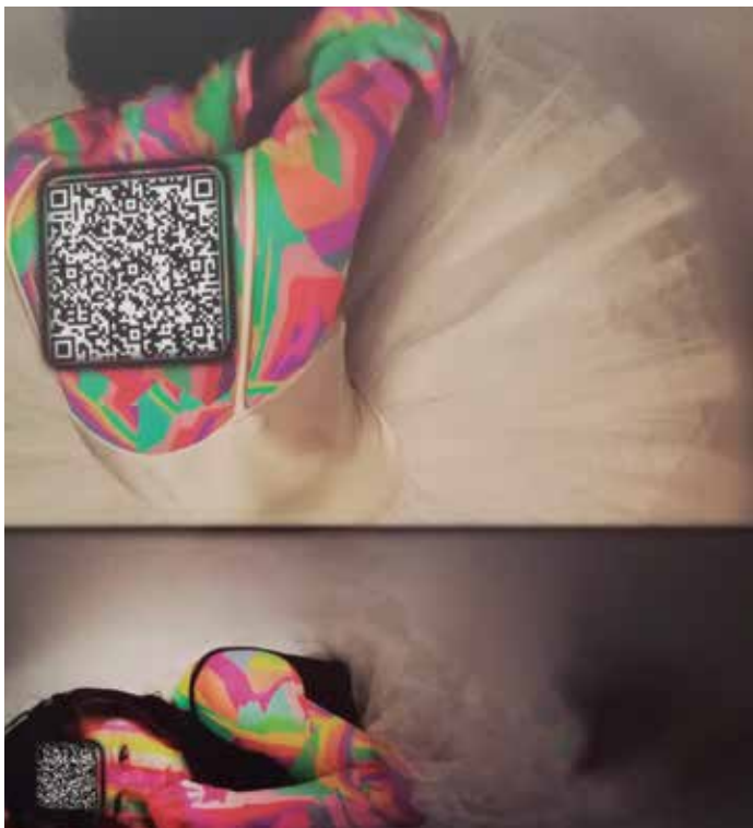
Obra de Linda Riseley

Proposta programada dins l'agenda del 8 de març, Dia Internacional de la Dona