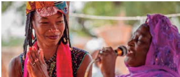
Fotograma Mali Blues

Proposta programada dins l'agenda del 8 de març, Dia Internacional de la Dona