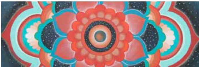
Fotografia d'Uma Maraval

Activitat programada com a part de l'exposició Art i Dona 2019.