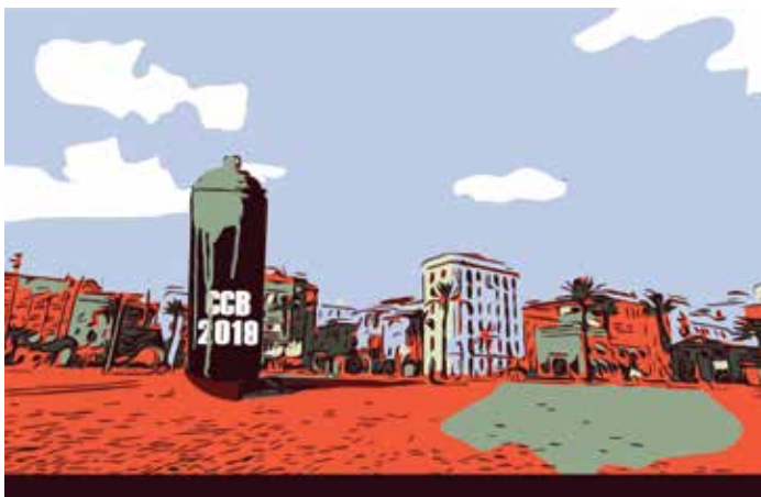
Obra de Gerson Ruiz