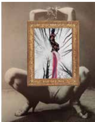
Collage de Julia Cosimi Canata