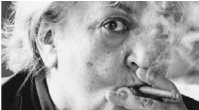
Fotografia: Maria Aurèlia Capmany