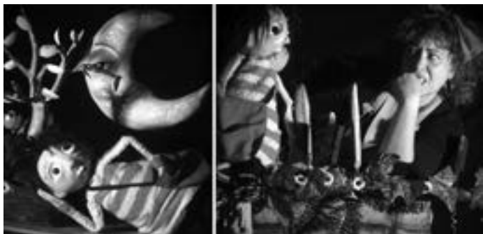
Fotografia: La Pantomima