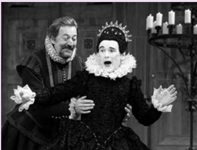
Fotografia: Stephen Frye and Mark Rylance