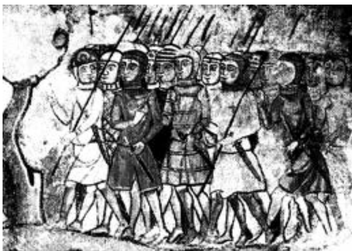
Ruta Barcelona Medieval. Pag.27 (Mural Gòtic S. XIII d'Almogàvers)