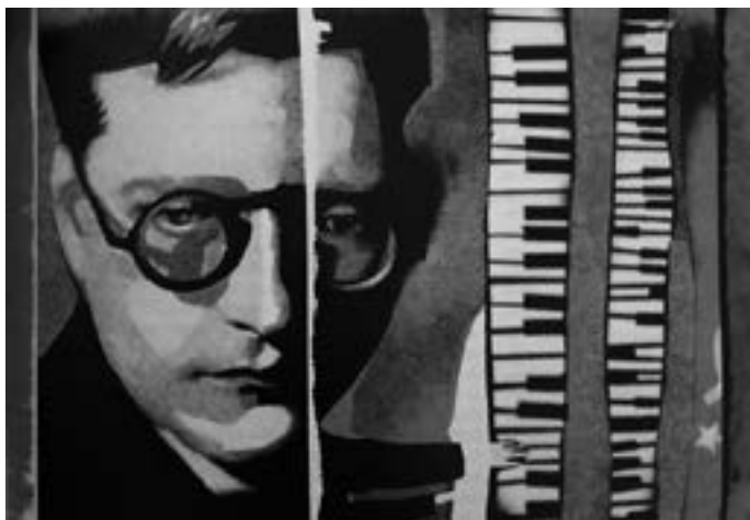
Dimitri Xostakóvitx, (audicions comentades, pàg. 25)