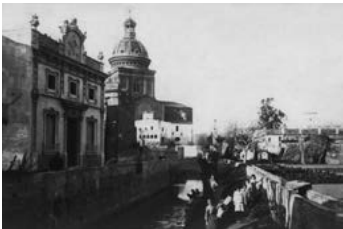
Fotografia: Carrer Cinca, dècada 1930

L'imaginari col·lectiu i la memòria ciutadana de la població barcelonina ha començat els darrers anys a destacar de manera singular el mil·lenari Rec Comtal. Construït al segle X, o fins i tot abans, encara sobreviu en els primers trams del seu recorregut. Aquesta exposició pretén donar a conèixer de forma sintètica i entenedora l'evolució històrica d'aquesta sèquia i la seva situació actual dins de la Barcelona del segle XXI.