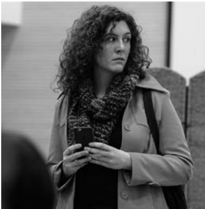
Fotografia: la porta de fusta

A càrrec de: Grup de teatre La Porta de Fusta.