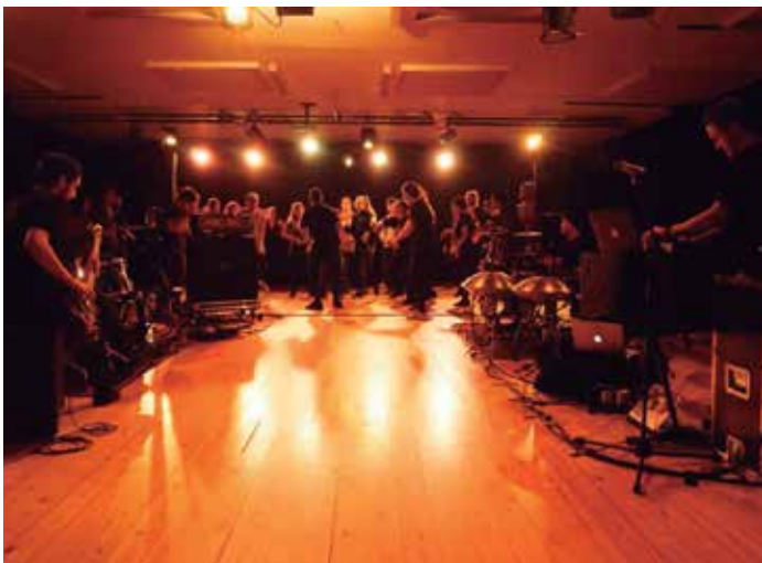
Fotografia del Centre Cívic Barceloneta

Abans de la música i la dansa està el moviment. Li donem la volta al joc. Creem música a partir del moviment del ballari/na; la música serà la que sorgeixi de l'emoció i la improvisació de les persones.