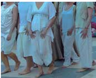
Fotografia del Centre Cívic Barceloneta