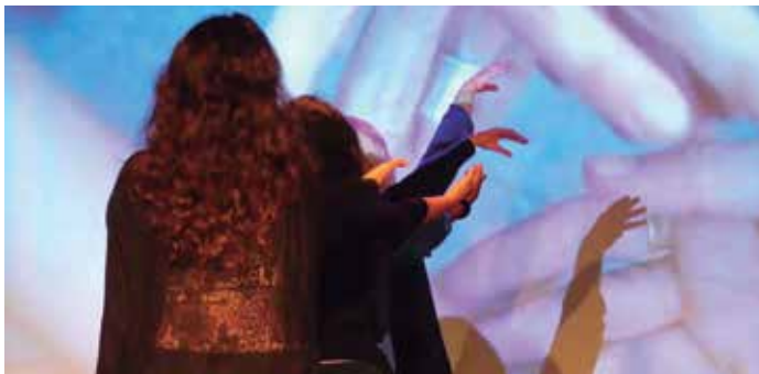
Fotografia del Centre Cívic Barceloneta

Tallers gratuïts per a dones de la Barceloneta. Places limitades Inscripcions: a la recepció del centre cívic. Apunta-t'hi a partir del 9 de setembre!