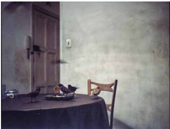
Fotografia de Carmen Secanella

Veïns que obren les seves llars per dibuixar la intimitat d'un barri. Ens podem identificar o reconèixer a éssers estimats. La Barceloneta podria ser una “petita Barcelona”, en la qual tot es troba i tot és possible. Exposició emmarcada en “Territori Barceloneta”, suport anual del Centre Cívic a un projecte d'investigació artístic relacionat amb el barri.