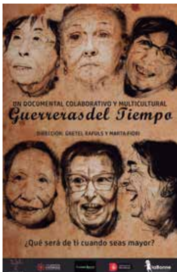
Cartell del documental Guerreras del Tiempo

Activitat programada en el marc del 25N –Dia Internacional contra la Violència vers les Dones