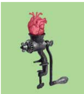
Imatge de Santi González

El festival de collage és un lloc de trobada de tots els apassionats del retalla i enganxa. El programa inclourà una exposició col·lectiva d'artistes del collage i diversos tallers-trobades pels amants d'aquesta tècnica i per a tot aquell que vulgui iniciar-se o que ja tingui una base.