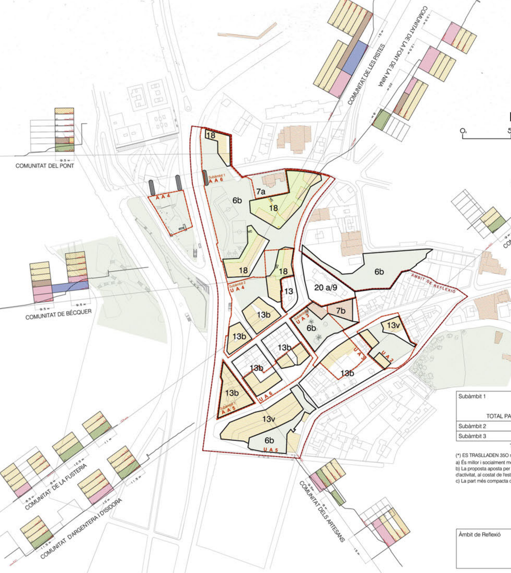
PLÀNOL DE ZONIFICACIÓ ESCALA EN METRES