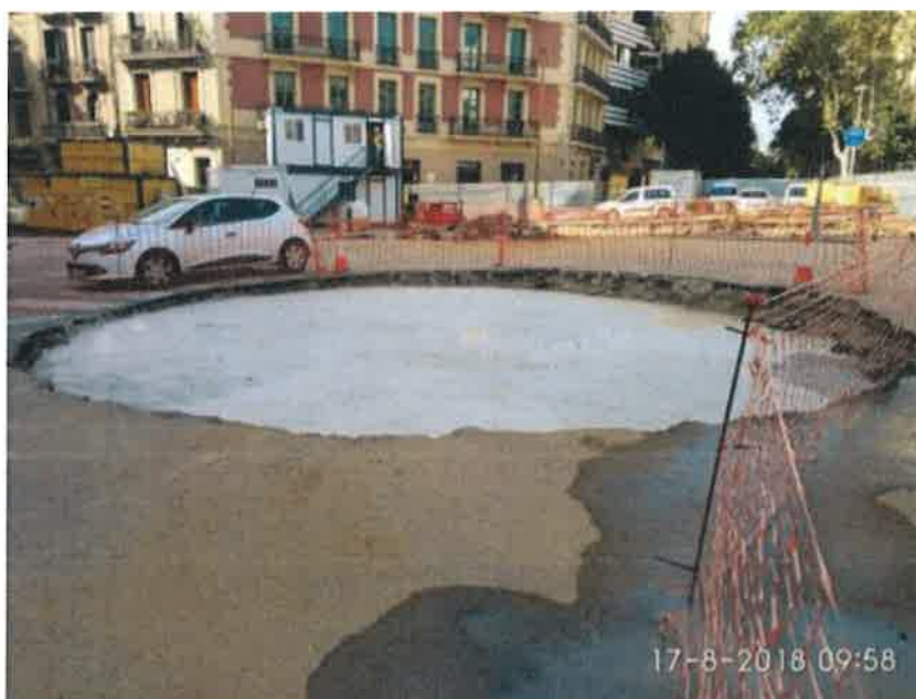
Foto 3 – Excavación y hormigón de limpieza en tanque de resurgencia.