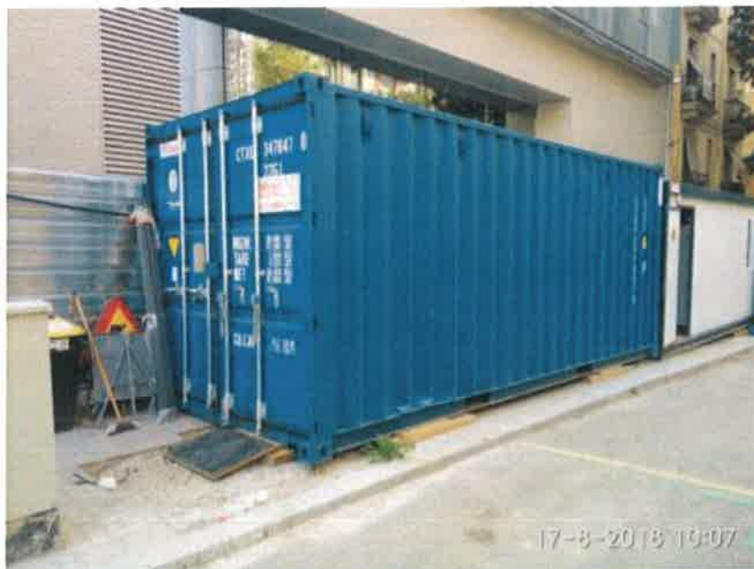
16 – Módulo herramientas.