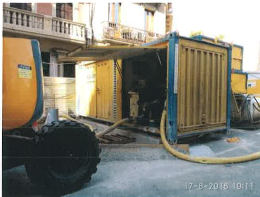
Foto 12 – Bomba de alta presión / Mandos línea lechada alta presión