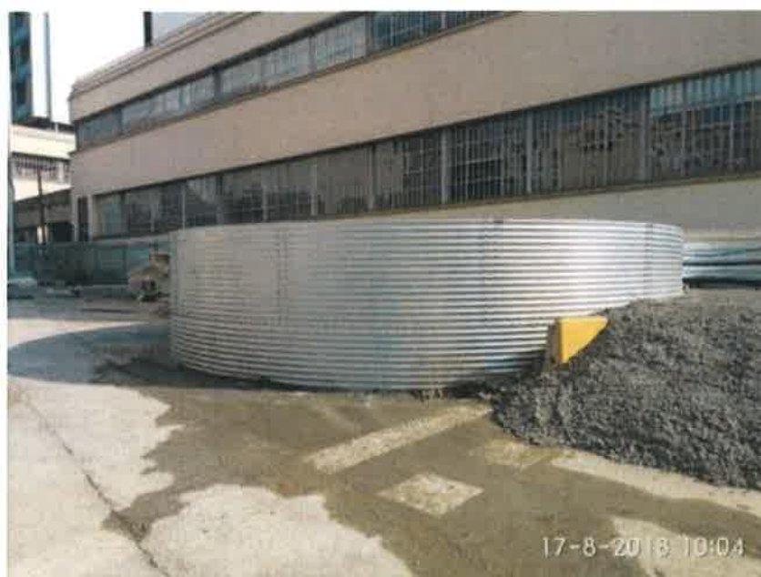
20 – Tanque de resurgencia.