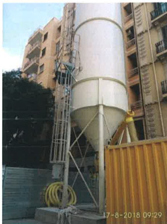
32 – Silo de cemento.

LÍNEA DE ALTA VELOCIDAD MADRID-BARCELONA-FRONTERA FRANCESA. URBANIZACIÓN ASOCIADA A LA CABECERA NORTE DE SANTS