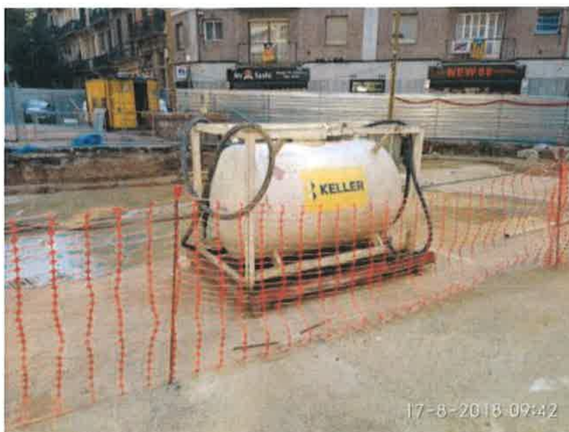
31 – Depósito de gasoil.