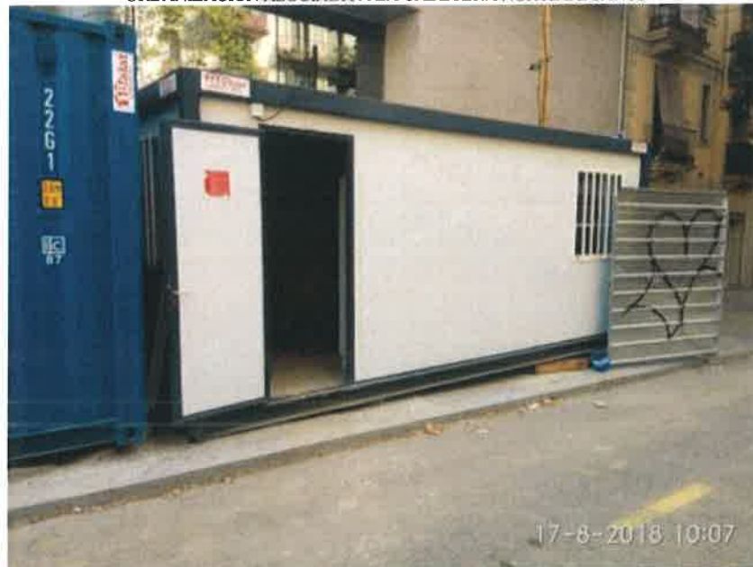
15 – Modulo vestuario de Keller.