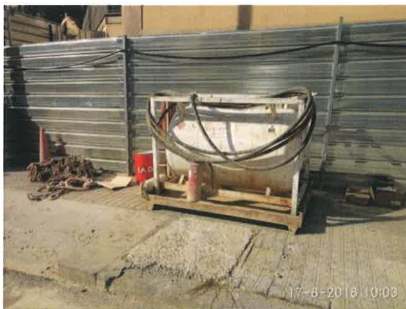
22 – Depósito de gasoil.