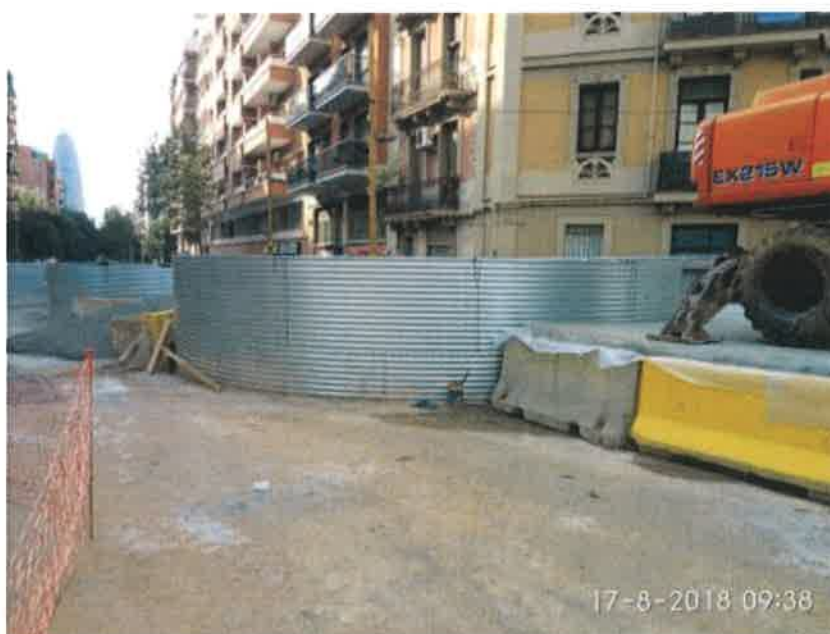
27 – Tanque de resurgencia.