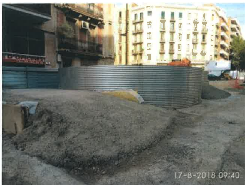
28 – Tanque de resurgencia.