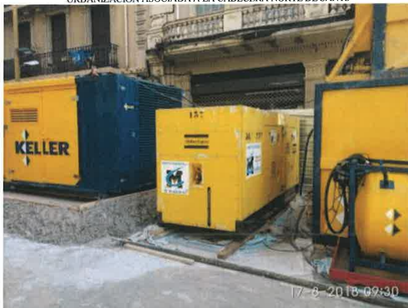
Foto 35 - Grupo eléctrico.

LÍNEA DE ALTA VELOCIDAD MADRID-BARCELONA-FRONTERA FRANCESA. URBANIZACIÓN ASOCIADA A LA CABECERA NORTE DE SANTS