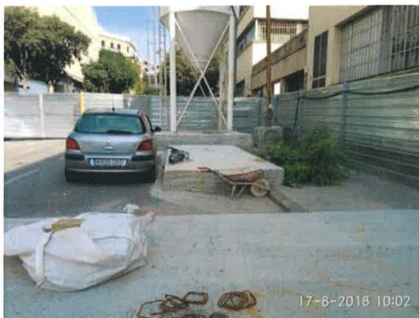
24 – Cimentación para tanque de agua.