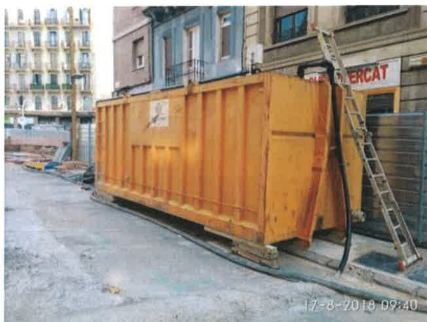
29 – Depósito de agua.