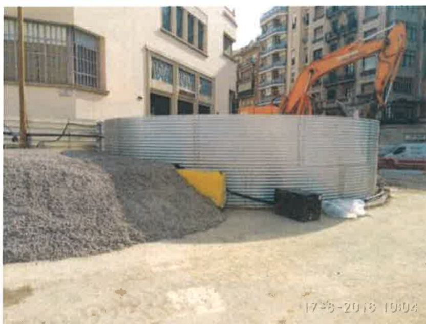
19 – Tanque de resurgencia.