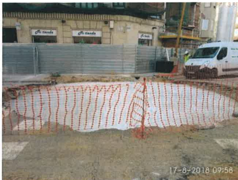
Foto 2 – Excavación y hormigón de limpieza en tanque de resurgencia.