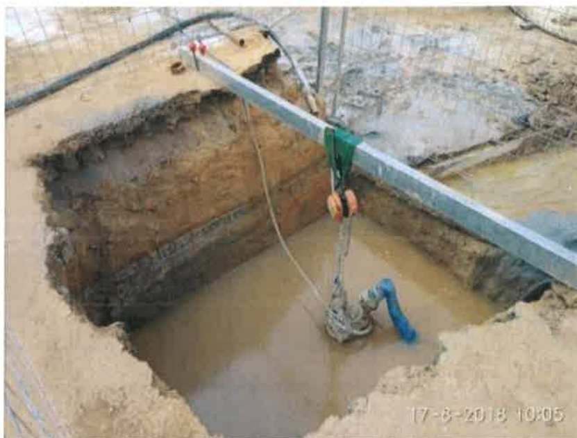
17 – Pozo recogida resurgencia.