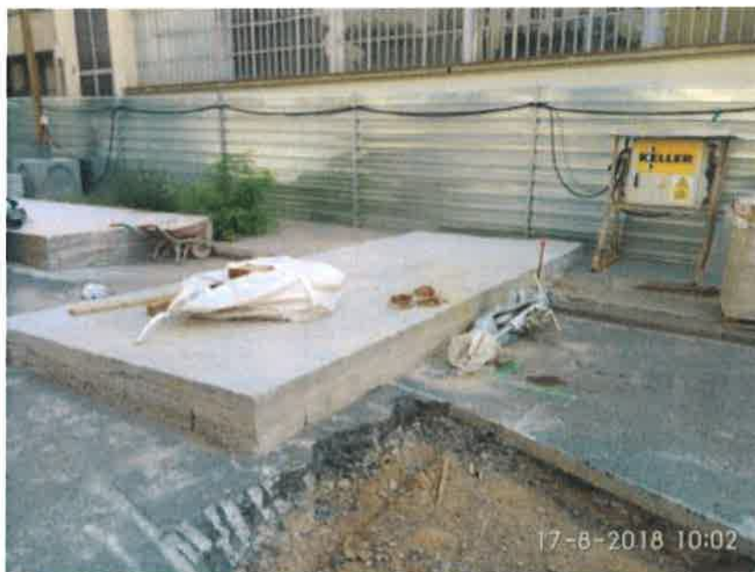
23 – Cimentación para la bomba de alta presión.