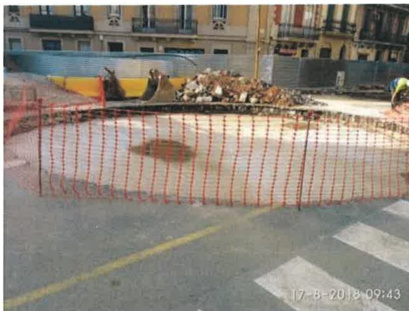
Foto 42 – Excavación y hormigón de limpieza en tanque de resurgencia.