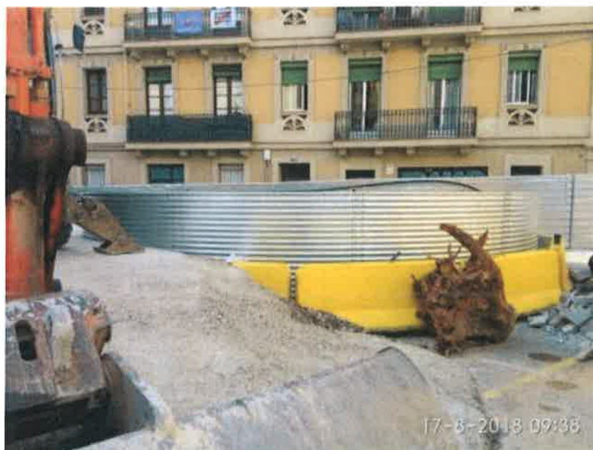
26 – Tanque de resurgencia.