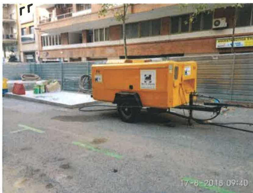
30 – Compresor. Al fondo de la imagen se aprecian las cimentaciones para la planta de fabricación y los silos.