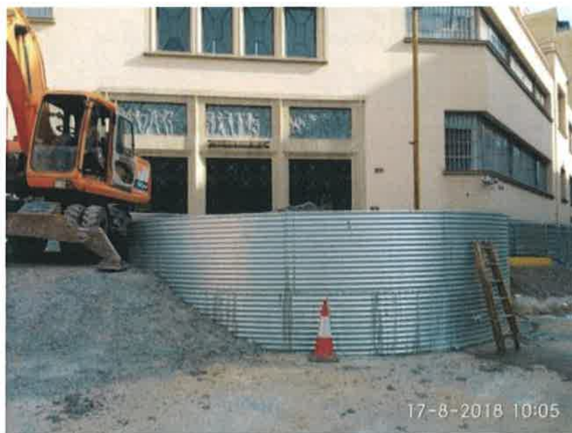
18 – Tanque de resurgencia.