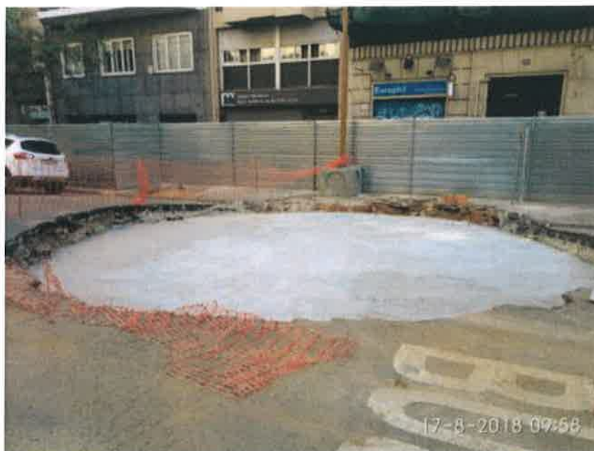
Foto 1 – Excavación y hormigón de limpieza en tanque de resurgencia.