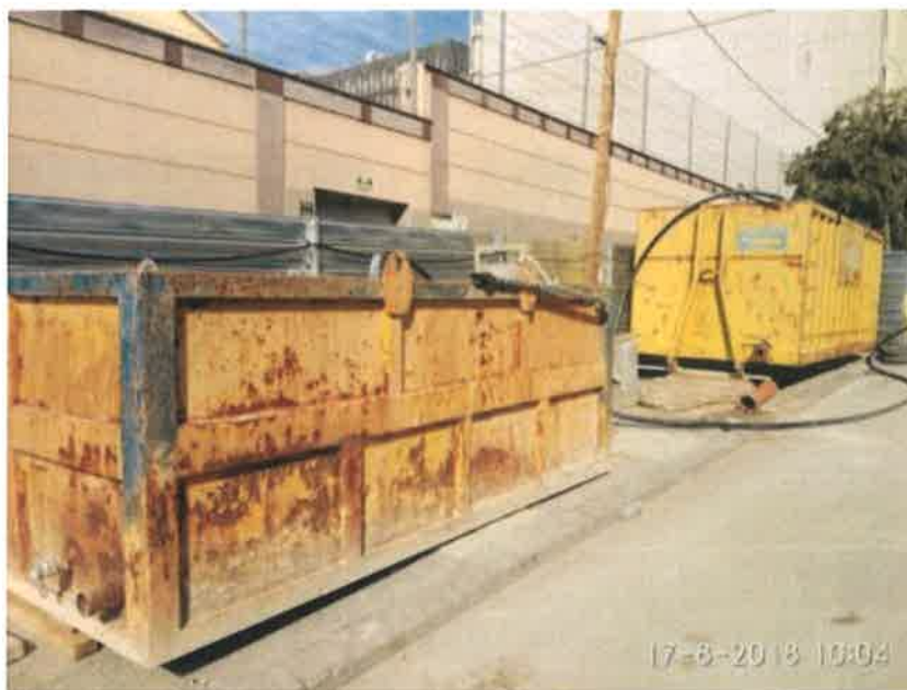
21 – Depósito de agua.