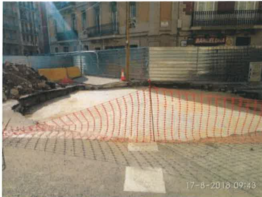
Foto 43 – Excavación y hormigón de limpieza en tanque de resurgencia.