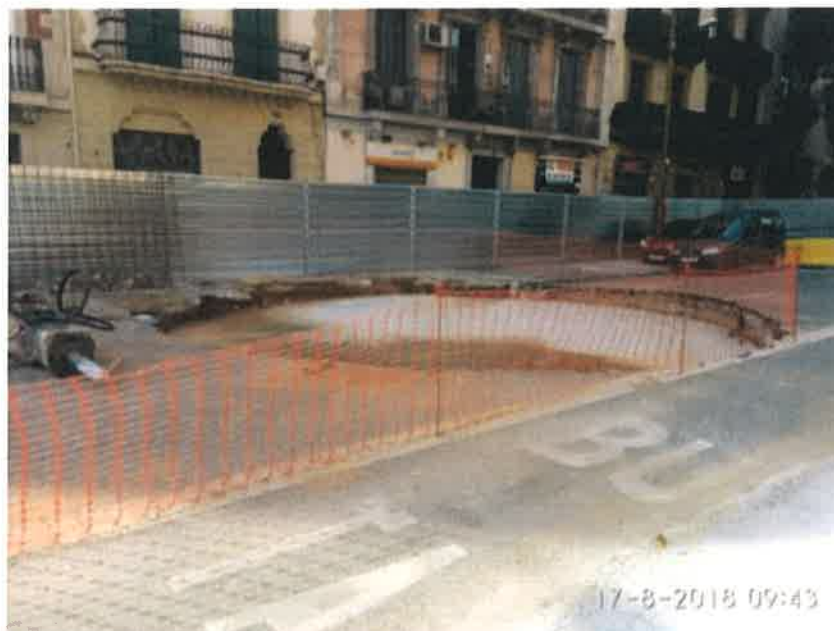
Foto 44 – Excavación y hormigón de limpieza en tanque de resurgencia.