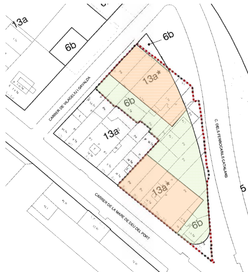
Qualificacions del planejament vigent.