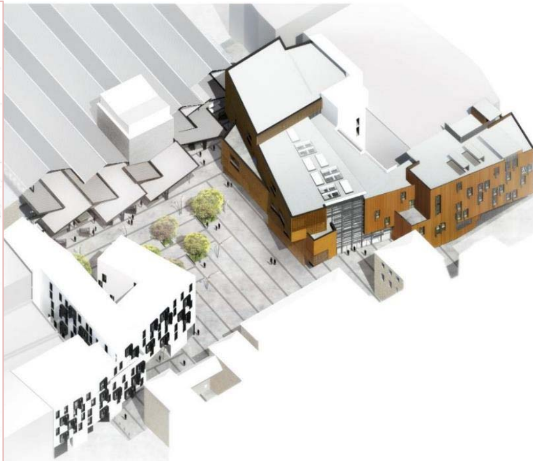
Imatge global de la Plaça de la Gardunya amb el mercat, l'escola Massana i la promoció d'habitatge.