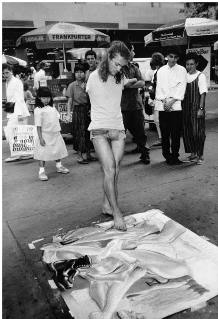
Sin título , (1982), fotografía en blanco y negro

En 1983 realiza una serie de fotografías a las que denomina Face Art donde el rostro es el operador de una incesante metamorfosis: se suceden las máscaras de la feminidad, de la masculinidad, con variaciones que aluden a otros tiempos y a otros lugares. El rostro es deshumanizado, animalizado o transfigurado a través de líneas que recuerdan los trazos tribales. La pintura no se realiza únicamente con pigmentos: Lorenza utiliza el vello corporal —la barba, las cejas— y el pelo como motivos formales y cromáticos con