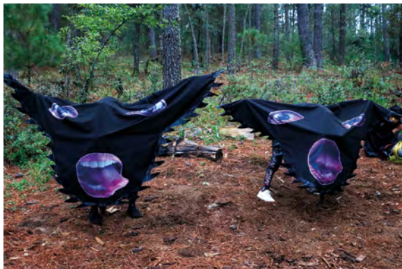
Naomi Rincón, Eclipse , Video Still, 2023