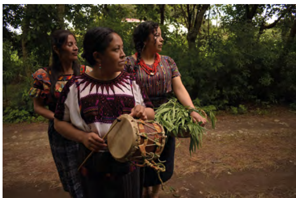
Grupo Ajchowen, Kotzijan, Florecer , Performance, 2023