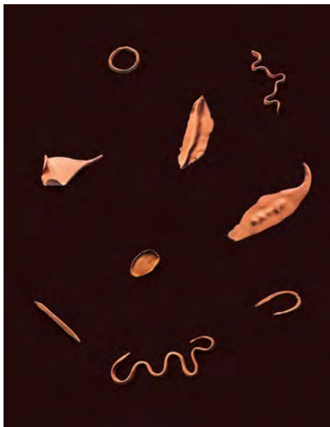
Imayna Cáceres, Se juntan, comen, ríen, bailan, se abrazan, cooperan, preconizan, sueñan, y se conectan al todo aun permaneciendo como parte , Instalación, 2023