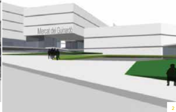
1 i 2. Imatges virtuals de l'entrada del futur mercat. 3. La Pepita Serra Roig, veïna del barri de 96 anys, veu amb il·lusió la nova etapa del mercat. 4. Els comerciants esperen eufòrics l'inici de la remodelació.