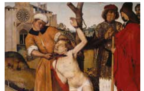
Ayne Bru, Martiri de sant Cugat (detall), 1502-1507. Museu Nacional d'Art de Catalunya