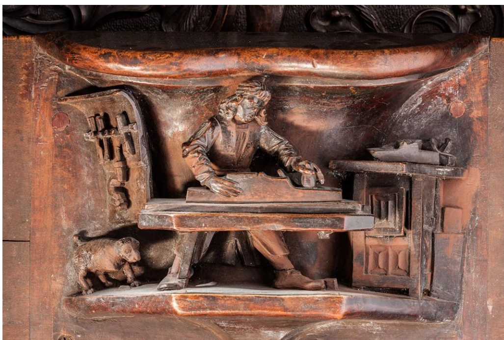
Misericordia del sitial del obispo. Catedral Nueva de Plasencia.

Una inmersión en la labor de investigación, conservación y restauración que ejercen los técnicos en las principales instituciones. Conoceremos las últimas innovaciones técnicas, la identidad del valor histórico y artístico de las obras, así como la importancia de la conservación preventiva en el ámbito de la salvaguarda y uso del patrimonio. A través de su conocimiento, especialización y metodología, diversos expertos en este campo compartirán con nosotros aspectos fundamentales de su práctica profesional.