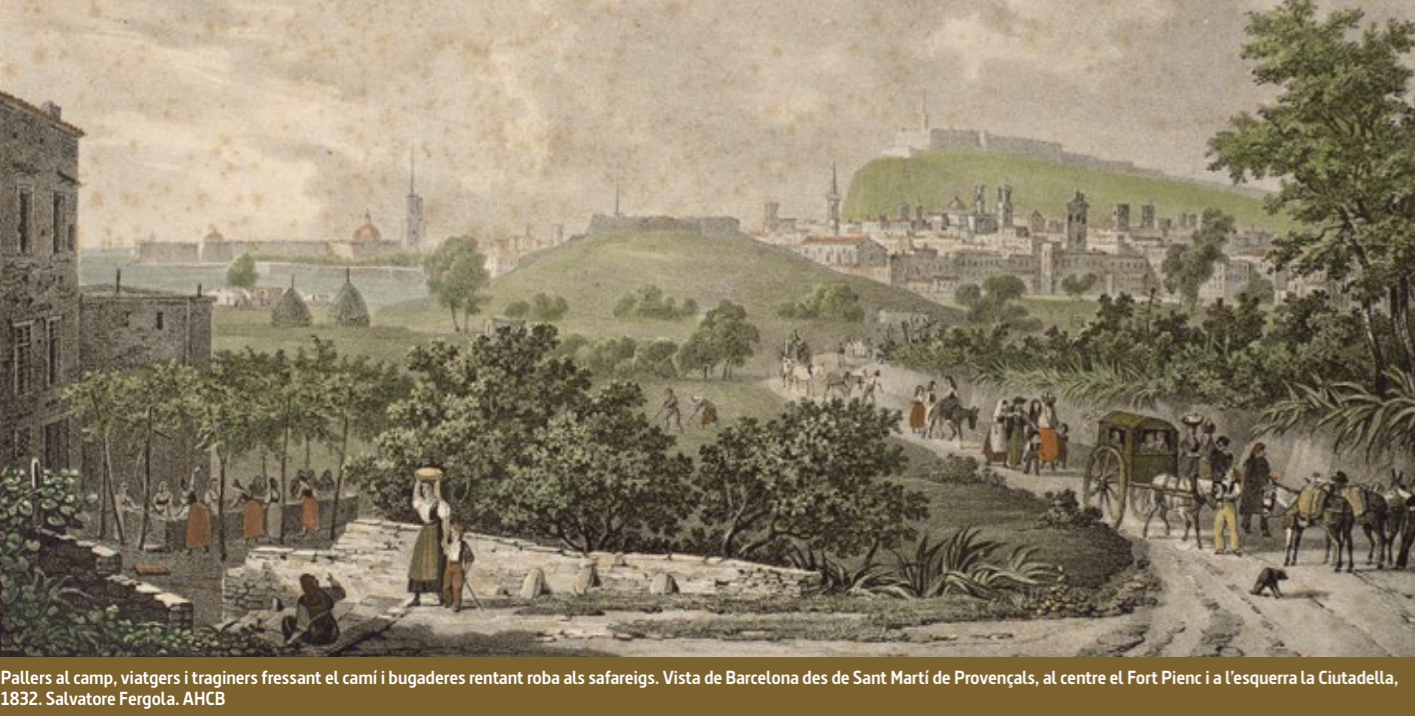
Pallers al camp, viatgers i traguers fressant el camí i bugaderes rentant roba als safareigs. Vista de Barcelona des de Sant Martí de Provençals, al centre el Fort Pienc i a l'esquerra la Ciutadella, 1832. Salvatorre Fergola.

La presència militar al territori martinenc s'allargaria molt temps més després de la guerra de Successió. La construcció de la Ciutadella borbònica (1716), sobre bona part de l'antic barri de la Ribera, va ser una empresa colossal. La normativa militar impedia construir res en un radi determinat