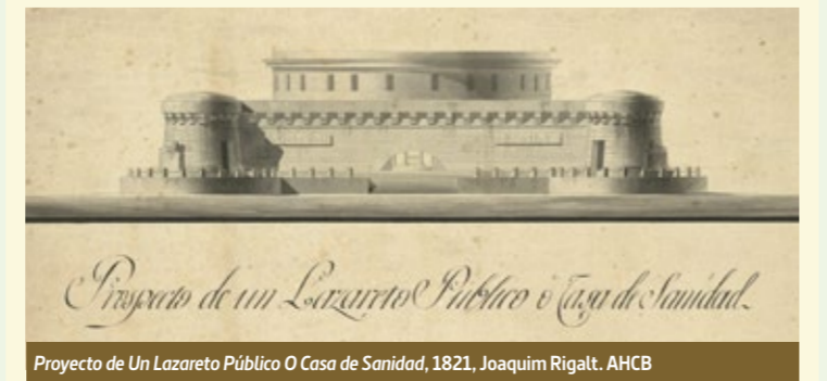
Proyecto de Un Lazareto Público O Casa de Sanidad, 1821. Joaquim Rigalt. AHCB