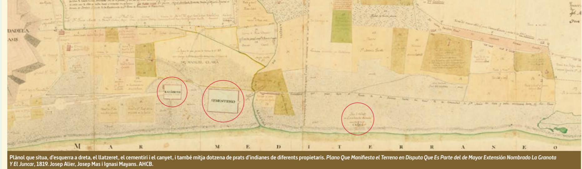
Plànol que situa, d'esquerra a dreta, el Llatzeret, el cementiri i el canyet, i també mitja dotzena de prats d'indians de diferents propietaris. Plano Que Manifiesta el Terreno en Disputa Que Es Parte del de Mayor Extensión Nominado La Granota Y El Junco, 1819. Josep Alíer, Josep Mas i Ignasi Mayans.