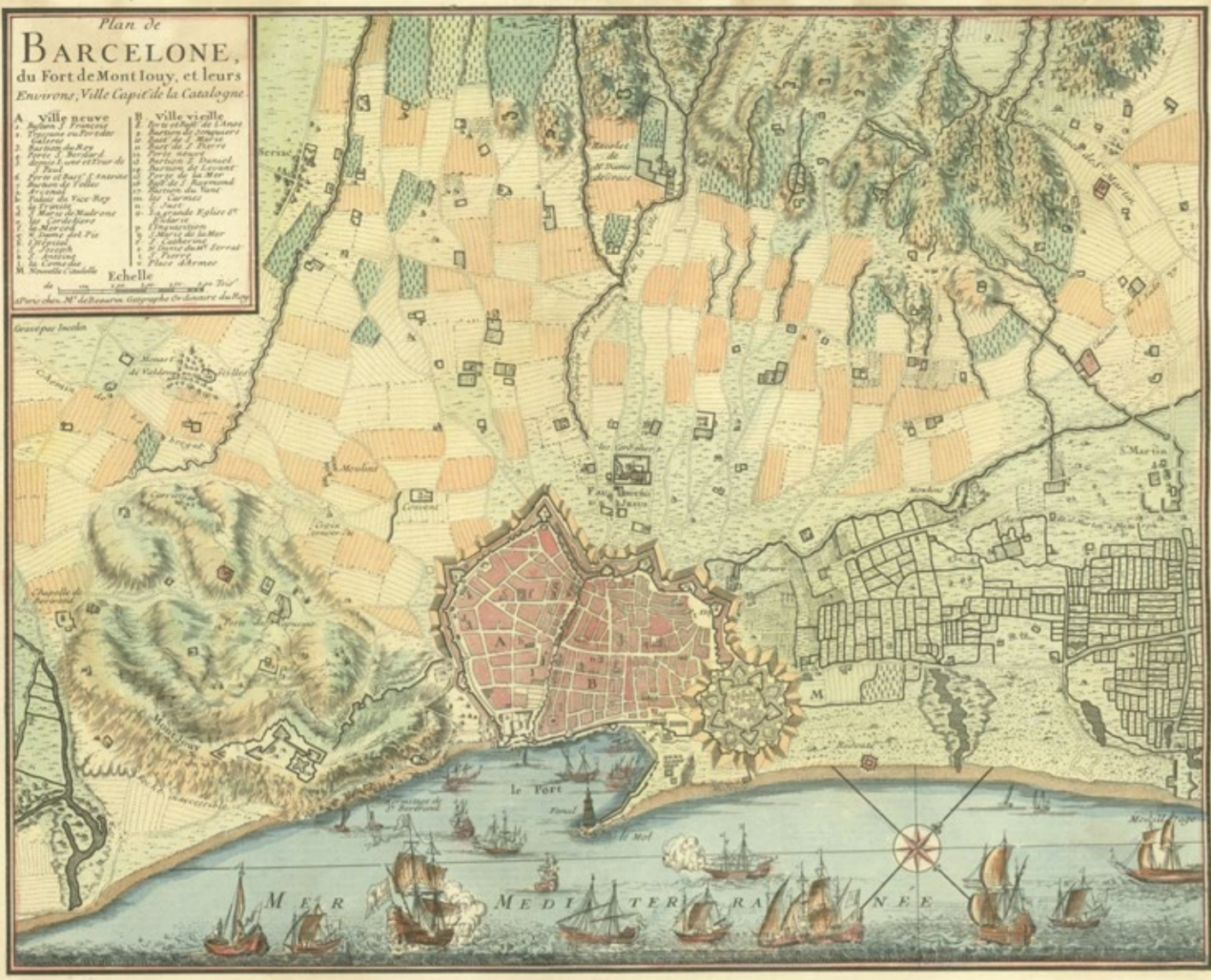
Mapa militar de Barcelona i del terme de Sant Martí. Destaca el fragmentat parcel·lari agrari de Sant Martí i les edificacions militars de la Ciutadella, el Fort Pius, els molins potvores prop del Portal Nou i un reduecte a la línia de costa. Plan de Barcelone, du fort de Mont louy, et leurs environs [...], 1751. C. Inselin - J. de Beaurain. AHCB

Guia editada amb el suport del Districte de Sant Martí