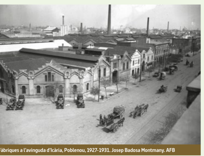
Fàbriques a l'avinguda d'Icària, Poblenou, 1927-1931.

Amb el temps, s'acabaren duent a terme a la zona totes les altres fases del procés productiu tèxtil, que comprenia la filatura, el tissatge, el blanqueig i l'estampació. Amb la Guerra Gran (1793-1795), la Guerra del Francès (1808-1814) i la pèrdua de les colònies americanes, les fàbriques d'indianes iniciaren la seva