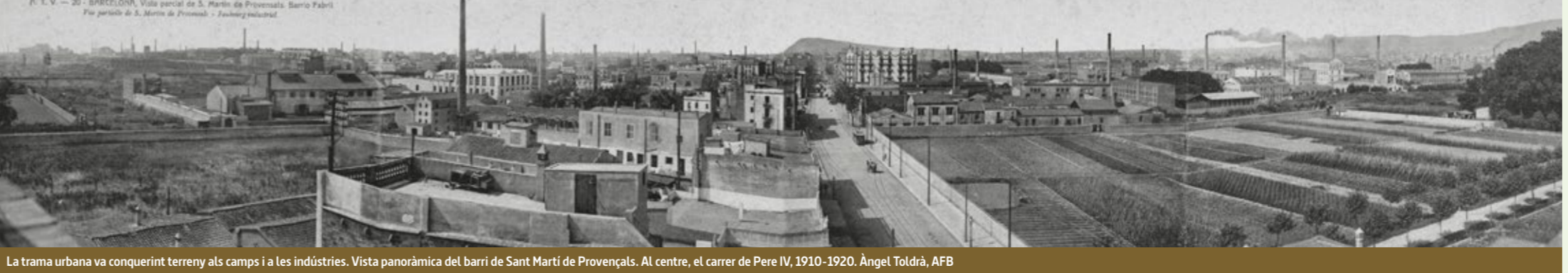
La trama urbana va conquerint terreny als camps i a les indústries. Vista panoràmica del barri de Sant Martí de Provençals. Al centre, el carrer de Pere IV, 1910-1920.

decadència i foren progressivament substituïdes pels vapors i les fàbriques de filats i teixits, que ocuparen el Poblenou. La saturació del sòl barceloní i la normativa de l'Ajuntament del 1846, que prohibia la construcció de fàbriques noves dins la ciutat, motivaren que s'acabessin concentrant més fàbriques a Sant Martí. Amb el temps, s'incrementà encara més la superfície disponible per a usos industrials, gràcies al dessecament de les llacunes, les millores a la carretera de Mataró (actual carrer de Pere IV) i al traçat del camí litoral, i es crearen les condicions idònies per establir les grans indústries del Poblenou.