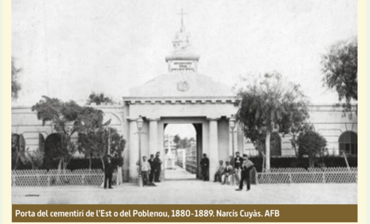
Porta del cementiri de l'Est o del Poblenou, 1880-1889.

després del 1714, el tribunal inquisitorial barceloní va desplaçar fora de les muralles de la ciutat l'indret d'execucions, prop del portal de Sant Daniel, dels condemnats a mort, que eren calcinats en aquest canyet i allà mateix se n'abandonaven les despulles. Cap al 1720 les autoritats municipals, pressionades per la pesta de Marsella, van construir un llatzeret prop del baluard de Sant Cristòfol, un equipament precari que