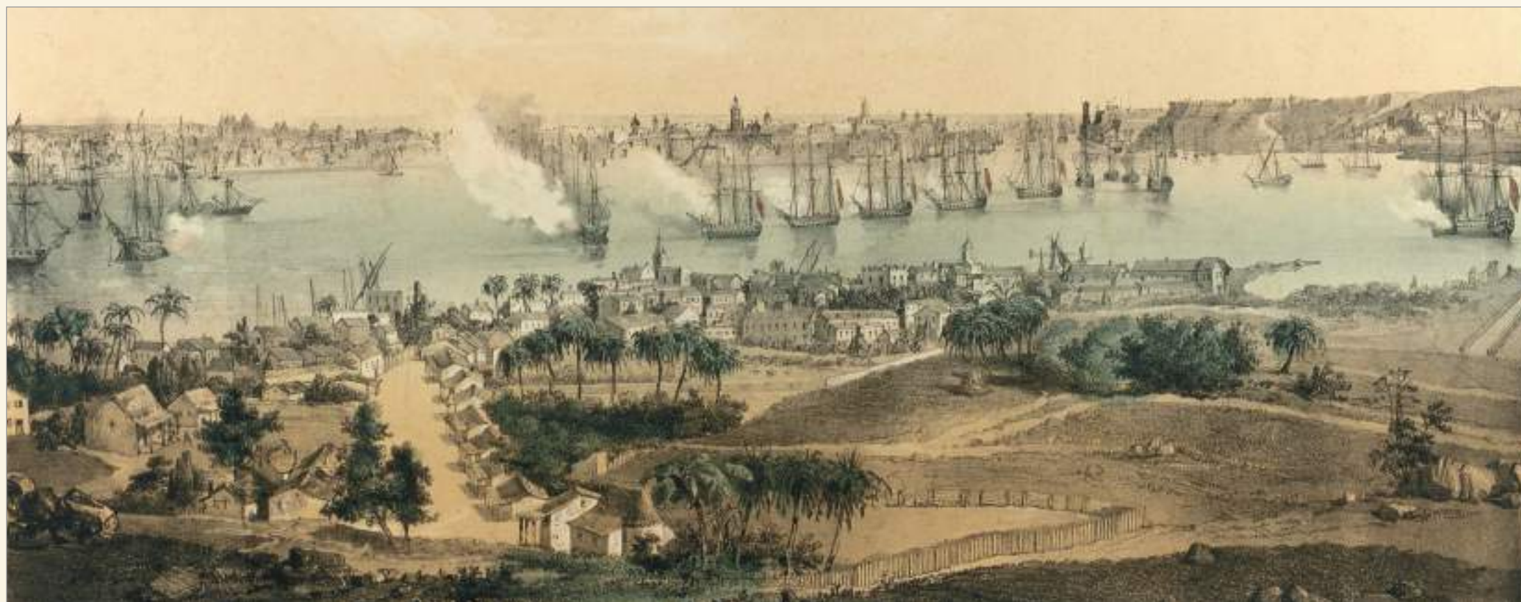
Port de l'Havana a mitjan segle XIX. MMB.