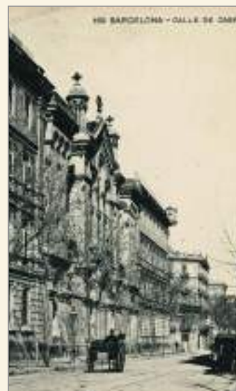
Església del Sagrat Cor dels jesuïtes, al carrer Casp, c. 1905.