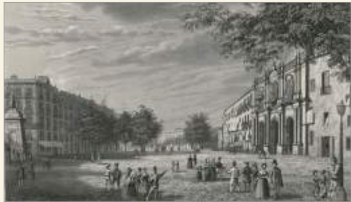
Gravat de la Rambla amb el pla de les Comèdies. Espanya. Obra Pintoresca, c. 1842.