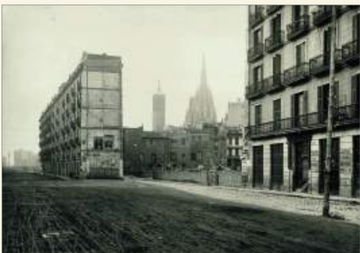
Carrer de la Riera de Sant Joan durant l'obertura de la via Laietana, 1908. Joan Vidal i Ventosa. AFB.