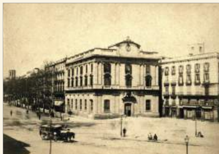
Vista de la Rambla amb l'edifici del Banc de Barcelona en primer terme, c. 1890. Josep Espigas. AFB.