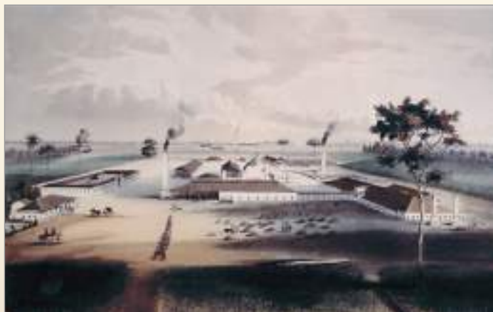
Ingenio Purísima Concepción (A) Echeverría. Justo G. Cantero, 1857.

Tanmateix, per què, sense oblidar l'enyorança de la terra que van deixar quan eren molts joves, es van veure motivats a tornar? Les successives guerres d'independència de les colònies de l'Imperi espanyol, la pèrdua dels privilegis que tenien els indians per portar a terme els seus negocis i la possibilitat de multiplicar el capital acumulat si s'establien a Barcelona van ser alguns dels estímuls per emprendre el retorn. Amb l'arribada dels indians, la capital catalana es va transformar en la capital del retorn d'Amèrica, la qual cosa va reforçar el seu potencial econòmic i mercantil, així com el seu desenvolupament urbà.