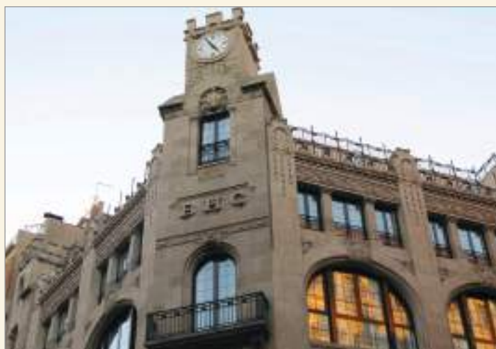
Edifici del Banc Hispano-Colonial. Aymara Arreaza, 2014.