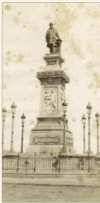
Monument a Antonio López en la seva ubicació original, 1880-1889.

Els edificis construïts per l'arquitecte Antoni Rovira i Riera es caracteritzen per la sobrietat formal; a les baranes de ferro no es distingeix res més que alguns elements marítims. A partir del 1844 es van començar a llogar els habitatges, assequibles només per a l'elit econòmica. Antonio López va viure en aquest immoble entre el 1856 i el 1861. Així mateix, el gener del 1847, en un dels locals de la planxa baixa porticada, al xamfrà que donava a la muralla, s'hi va instal·lar la societat financera anomenada Vidal Quadras Hermanos.