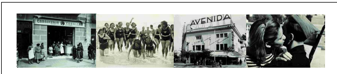
Arxiu Històric de la Ciutat de Barcelona. Arxiu Fotogràfic. © AHCB-AF