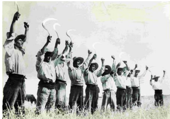
Camperols saludant a les milícies. Autor desconegut. Juliol de 1936. © AHCB-AF

L'arquitectura de les parets seguirà l'arquitectura de les imatges, formant-se zones de "baix relleu" o reculades coincidint amb els elements arquitectònics de les fotografies (portes, finestres, etc.). Aquestes parts retirades portaran il·luminació per poder destacar mitjançant un sistema backlight els graffitis .