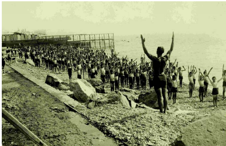
Escola del Mar. Josep Maria Sagarra. 1925-1935.

Una platja amb sorra on reposa un cubell, olor a mar, so a ones i crits infantils, i una projecció en vídeo d'imatges de l'època on es veuen els alumnes entrar al mar de la Barceloneta.