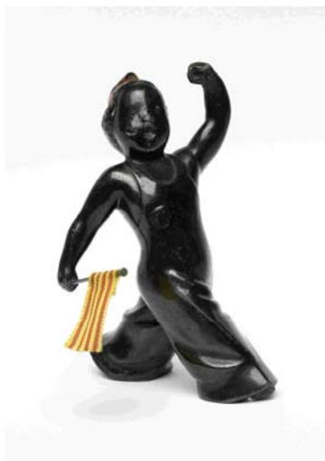
El més petit de tots.

Bona part de la vida es feia al carrer, fos per gaudir del lleure conquerit amb les millores laborals (nous horaris de treball, dies festius, etc.), fos per explicitar la lluita interna d’una societat plena de desigualtats.