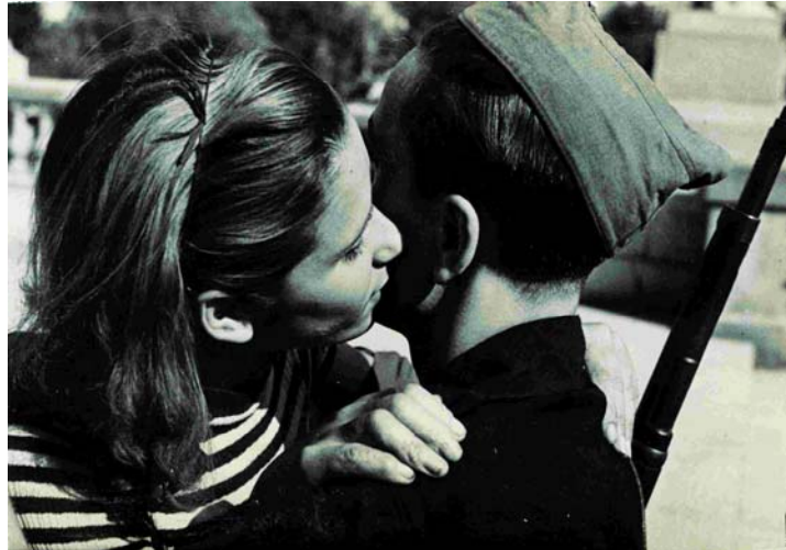
Comiat d'un milicià. Marco. 22/7/1936.

La reraguarda, la indústria de guerra, els joves cap al front, els uniformes de cadascuna de les milícies que van inundar els carrers, els hospitals, els menjadors públics, els bombardeigs... Com un mal despertar, en sortir del cabaret i entrar en aquest àmbit, on s' anuncia que ha esclatat la guerra.