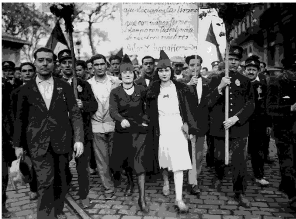
Proclamació de la República. 15/04/1931

L'exposició presenta la seva declaració de principis: joves somrients pels carrers de Barcelona celebrant l'arribada de la II República; hi ha olor a clavells i música d'ambientació de festa on sona “La Marsellesa”.