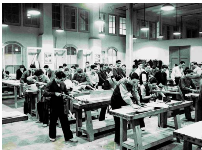
Escola Taller. Pérez de Rozas. 13/2/34.

L'arquitectura de les parets seguirà l'arquitectura de les imatges, formant-se zones de "baix relleu" o reculades coincidint amb els elements arquitectònics de les fotografies (portes, finestres, etc.). Aquestes parts retirades portaran il·luminació per poder destacar mitjançant un sistema backlight els graffitis .