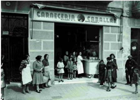
Carnisseria de cavall. Pérez de Rozas. 10/3/1934. © AHCB-AF.

Aquest espai explica el que va suposar la proclamació de la República per les dones: el dret a votar, el dret al divorci i la seva irrupció a la vida pública de la ciutat i del país.