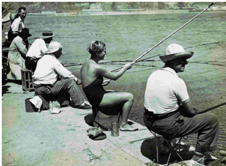
Concurs de pesca amb canya celebrat a l'escollera de l'est. 5/8/1934.

Una nova imatge de la dona: bella, decidida i implicada en tots els aspectes de la vida urbana.