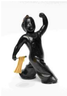
El més petit de tots.

Es col·loca una vitrina il·luminada amb l'escultura "el més petit de tots".