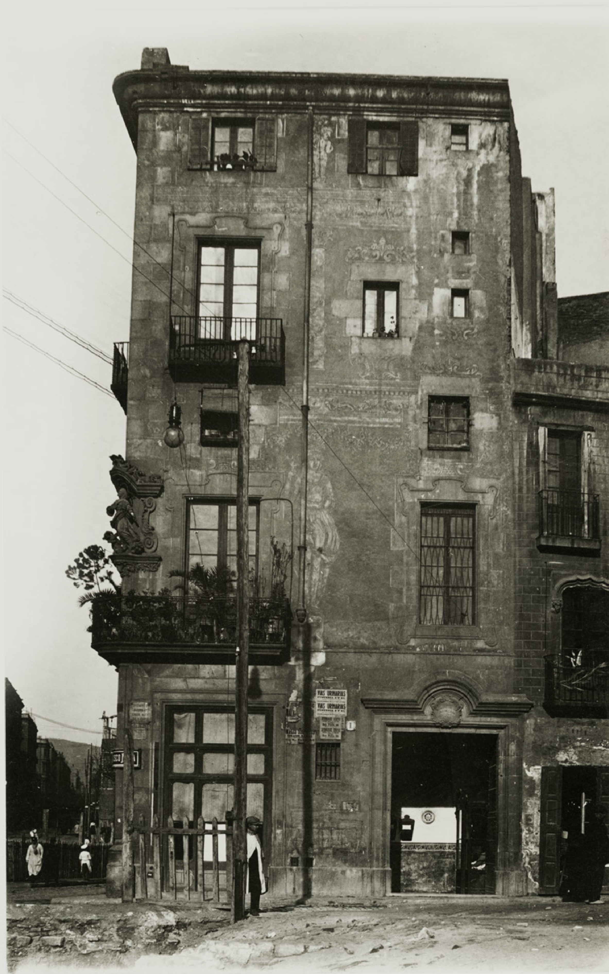
Casa del gremi de Velers, de Frederic Ballell (1888). Fons: Arxiu Fotogràfic de Barcelona