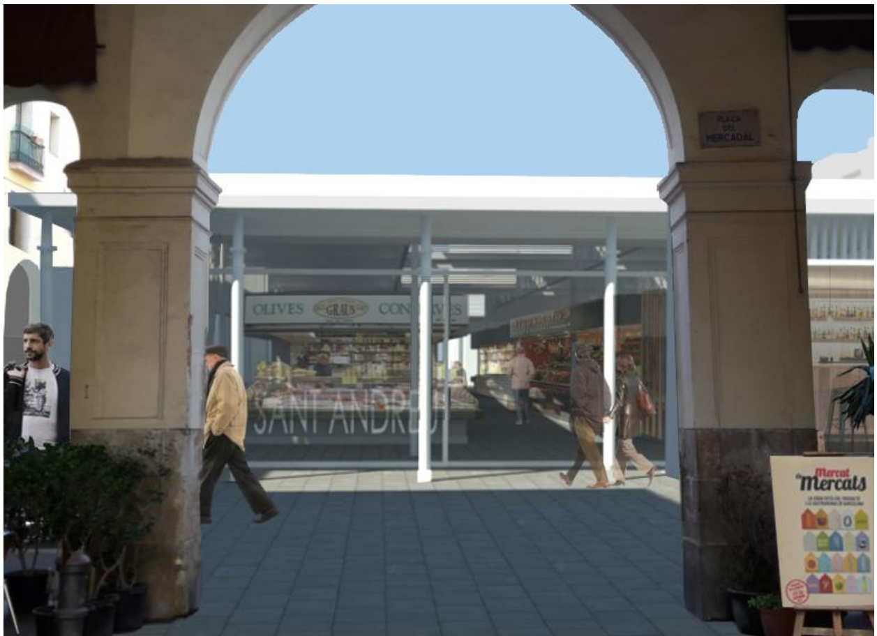
Imatge virtual del futur mercat.