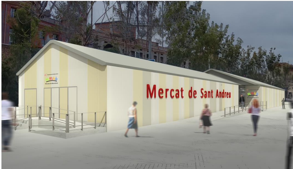
Imatge virtual del mercat provisional