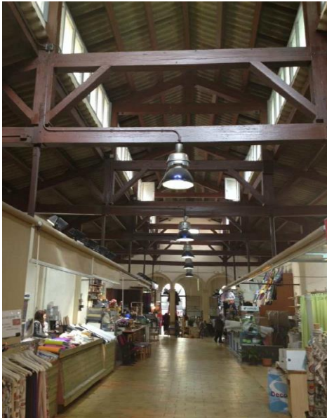
Imatge actual del Local de Vendes

La remodelació suposarà una inversió de 9,5 milions d'euros, incloent el mercat provisional i els dos espais que componen el mercat de Sant Andreu, l'edifici central on es concentra l'oferta de producte fresc, ubicat al mig de la plaça, i l'anomenat Local de Vendes on estan els establiments no alimentaris, formant part d'un dels edificis que envolten la plaça Mercadal i que connecta aquesta amb el carrer Ruben Darío.