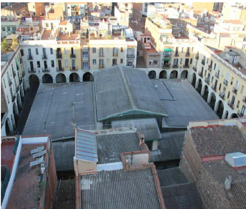
Vista actual de la coberta del mercat de Sant Andreu