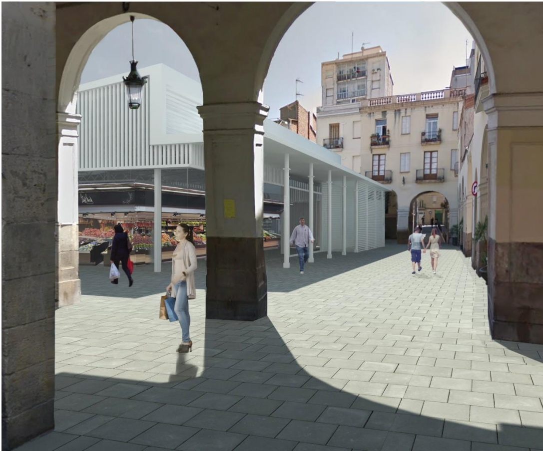
Imatge virtual de la futura plaça Mercadal i el mercat.