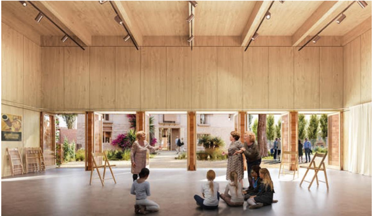
Imatge 3 de la proposta guanyadora: Nou espai Can Garcini

Amb la resolució del concurs i la presentació als veïns i les entitats del barri és fa un pas endavant per acabar el projecte executiu d'aquest nou equipament aquest mandat.