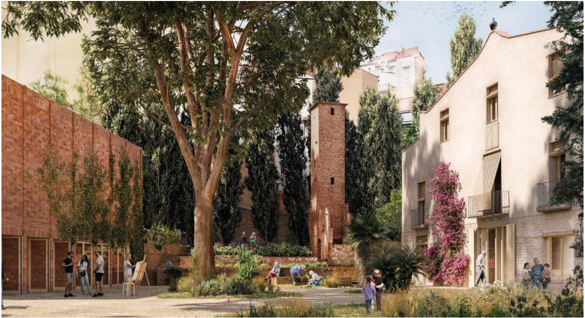
Imatge 1 de la proposta guanyadora: Ecosistema urbà