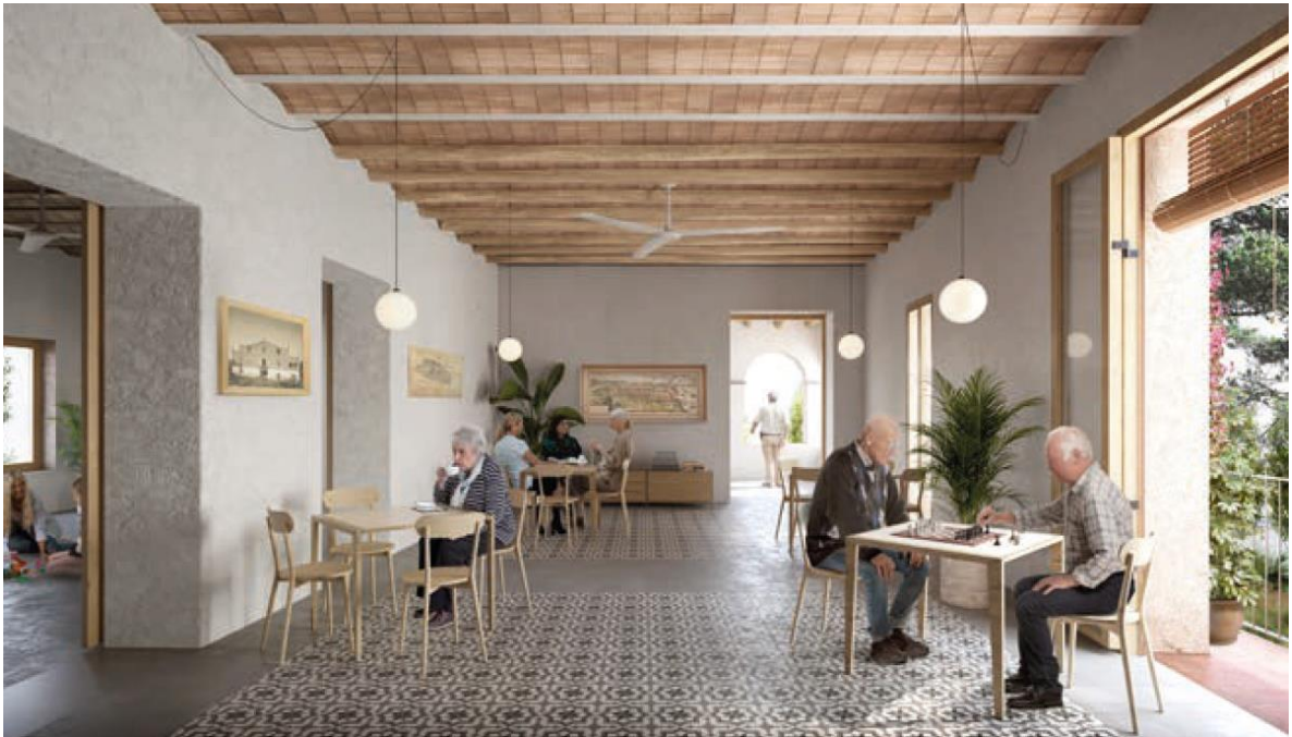
Imatge 2 de la proposta guanyadora: Centre cultural per la gent gran