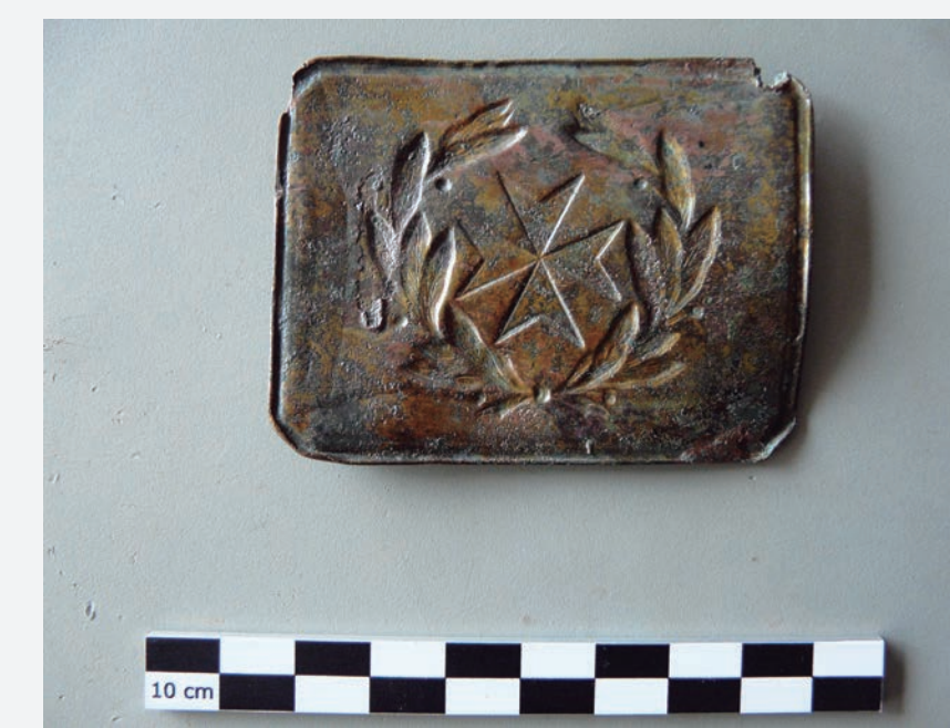
14. Sivella de cinturó amb la insígnia de la Sanitat Militar Republicana trobada a les deixalles al voltant de l'entrada pel C/ Vistalegre 11.