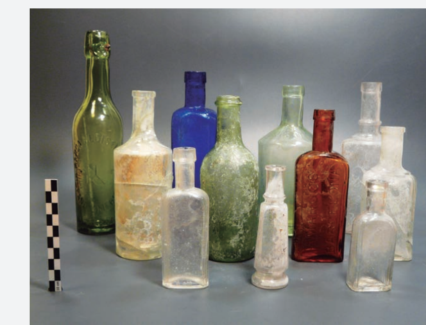
15. Conjunt de diverses ampolles trobades entre les deixalles al voltant de l'entrada pel C/ Vistalegre: Ampolla de "Aguas de San Judas Tadeo" per al tractament de malalties digestives, una ampolla blava de Solution Pautouberge de París per al tractament de malalties pulmonars i pots de diverses farmàcies com Amargós de Barcelona.