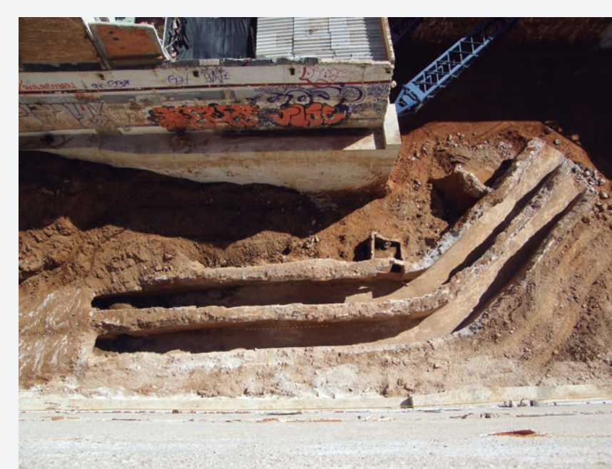
6. Tram de l'interior del doble túnel que s'uneix amb l'entrada pel C/ Riereta 4c.