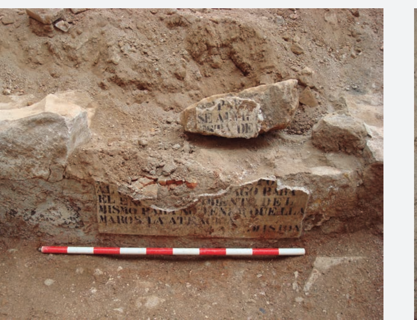
12. Part del text del cartell trobat a l'entrada pel C/ Vistalegre 11: "para... / se advierte... / esto den... / .... pongan / al... / pago para / el en... / amiento del / mismo para no tener que lla / maros la atención / La comisión"