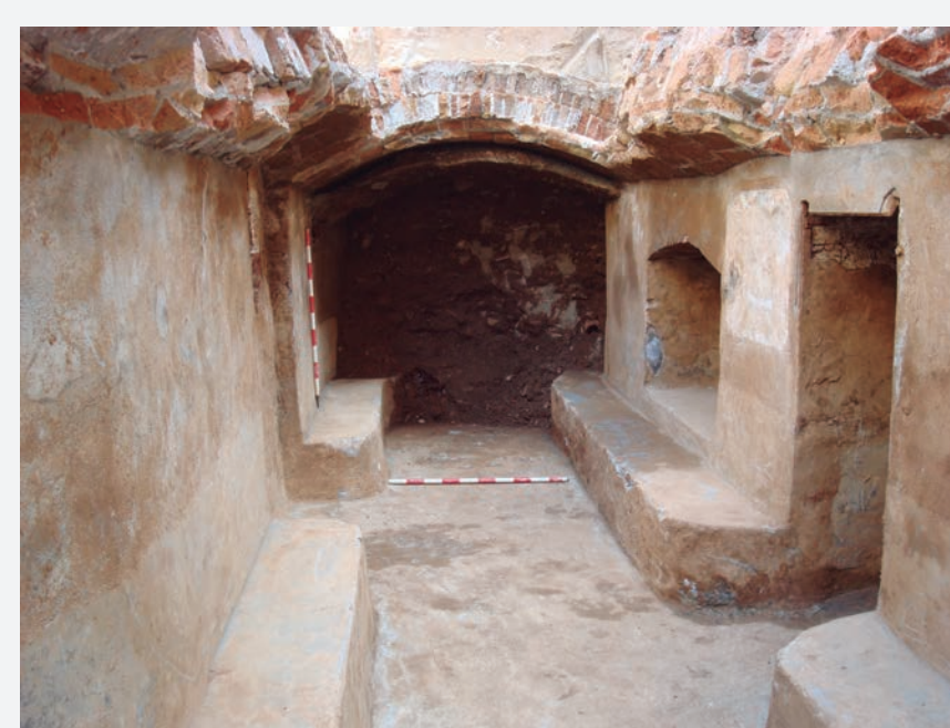
5. Secció de l'interior del túnel ampli on es pot veure els bancs, les fornícules i la porta de comunicació amb els altres passadissos.