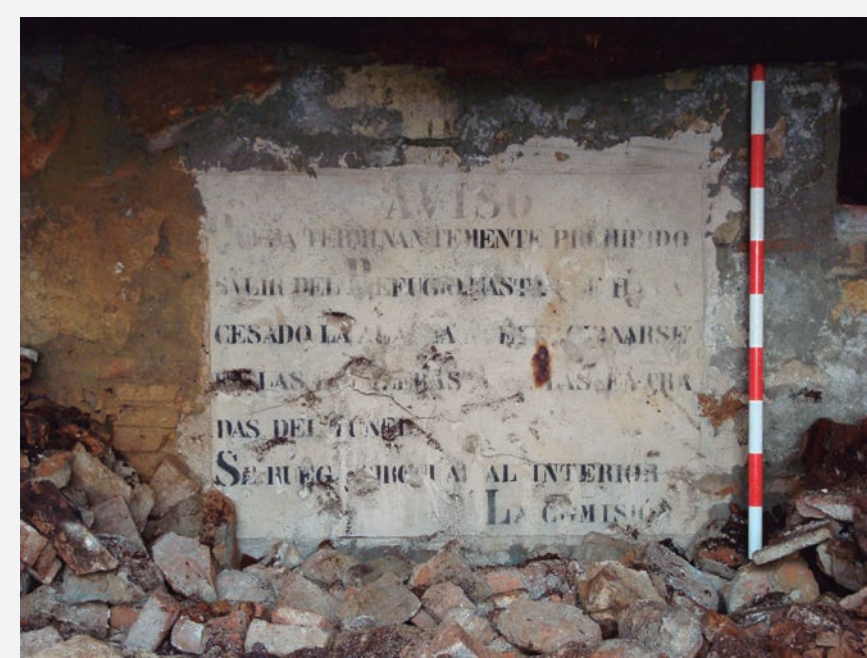
10. Text del cartell localitzat a l'entrada pel C/ Riereta 4c: "AVISO / Quedo terminantemente prohibido / salir del Refugio hasta que haya / cesado la alarma, (no) estacionarse / en las escaleras (y en) las entra / das el túnel / Se ruega circular al interior / La comisión"