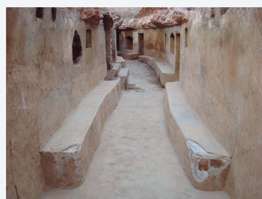
4. Interior del passadís ampli amb bancs correguts als costats i fornícules de diverses mides.