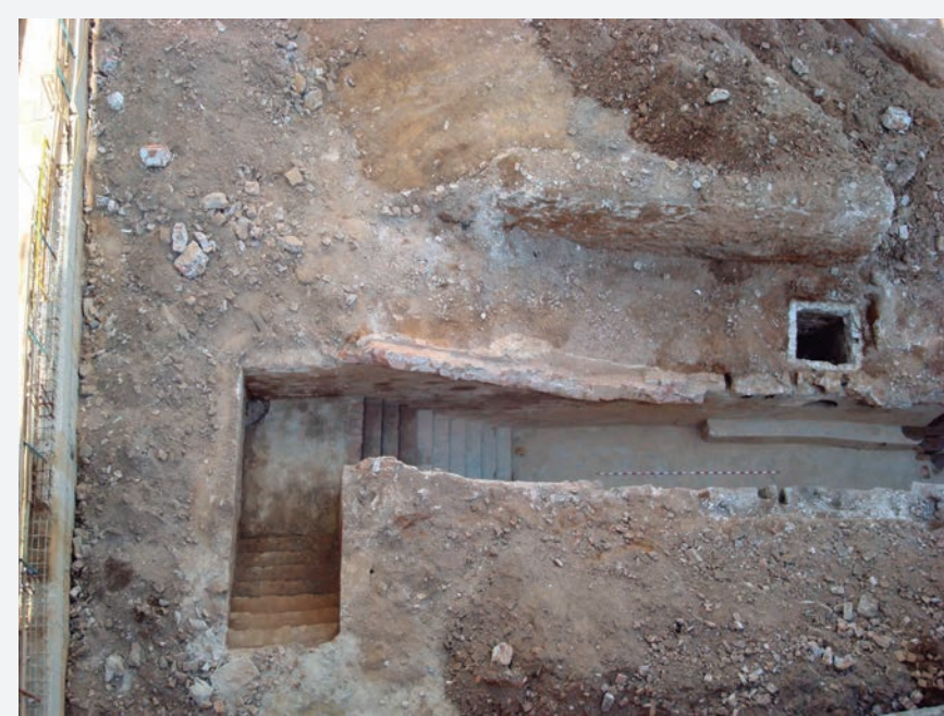
1. Escaleres de l'entrada al refugi pel carrer Vistalegre

Un cop acabada la Guerra Civil els refugis es van abandonar i van perdre la seva funcionalitat. Alguns d'aquests refugis es van enderrocar, uns altres es van segellar amb terra i altres es van aprofitar amb altres finalitats seguint un pla de reordenació dictat per l'Estat. Aquest refugi es va segellar amb terra i runa fins a arribar al sostre i es van enderrocar les diferents entrades.