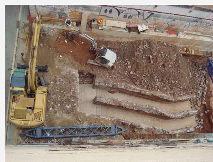
7. L'entrada al refugi pel C/ Riereta amb les escales fent zig-zaga.