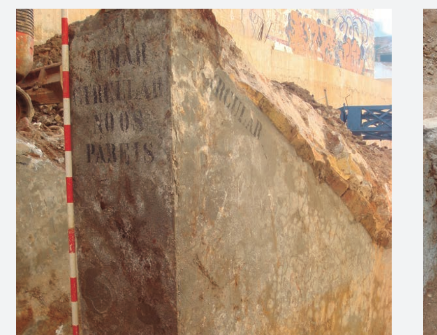
11. Text pintat a la paret a l'entrada pel C/ Riereta 4c: "NO FUMAR / CIRCULAR / NO OS PAREIS" - "CIRCULAR".