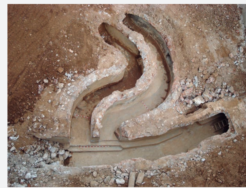
3. Vista aèria de l'interior del doble túnel en "S".