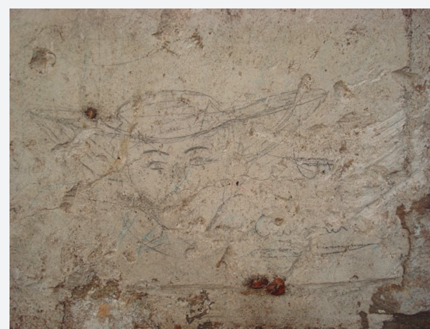
13. Dibuix a carbó i amb bon traç d'una dona amb barret.