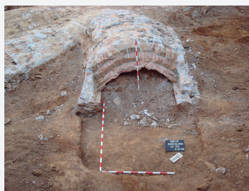
8. Pou de ventilació o respirador al final d'un túnel inacabat.