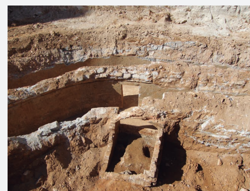
9. Pou de ventilació o respirador quadrangular.