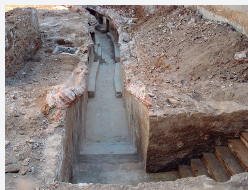
2. Interior del passadís ampli que va de nord a sud