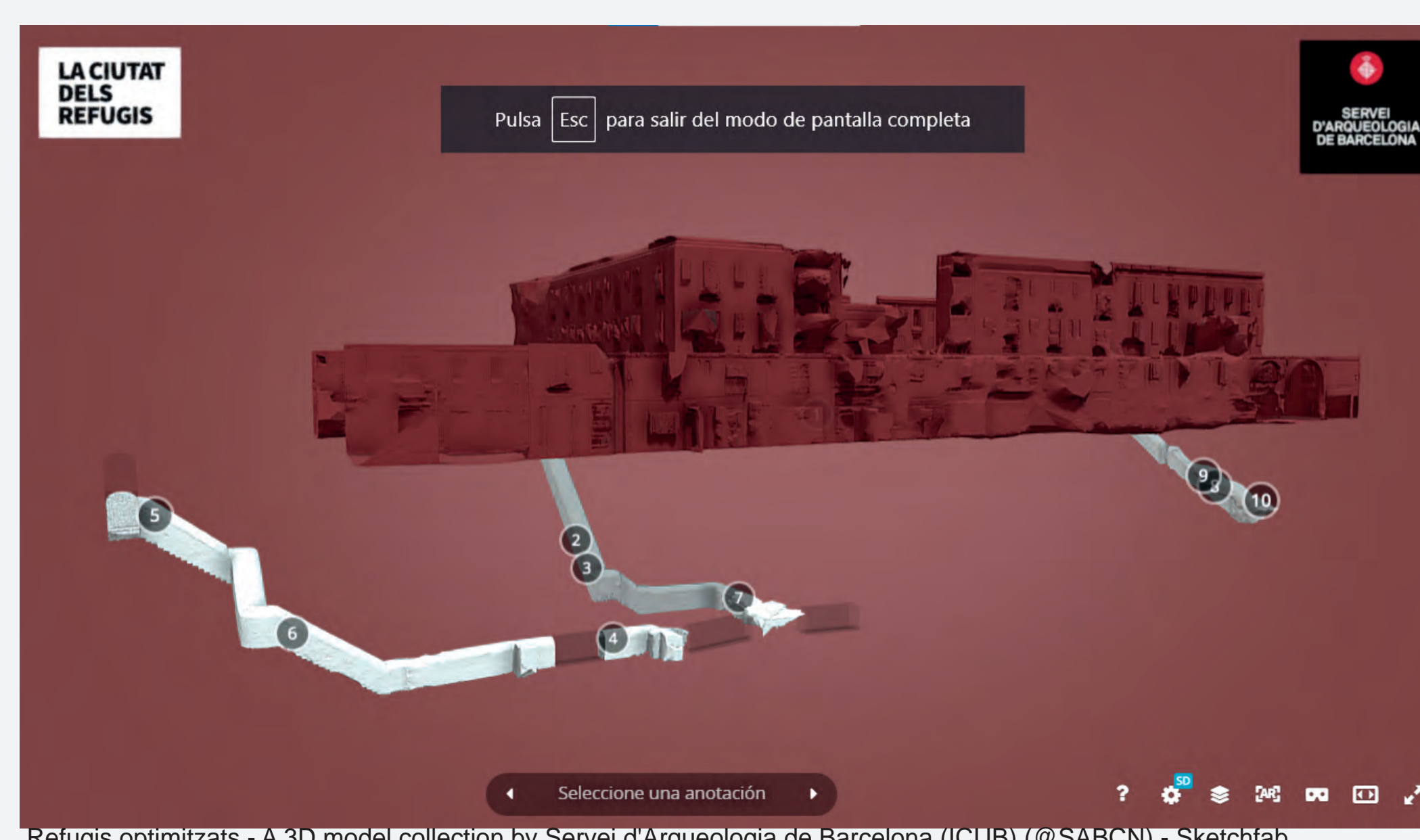
Refugis optimitzats - A 3D model collection by Servei d'Arqueologia de Barcelona (ICUB) (@SABCN) - Sketchfab

Els accessos 2 i 3 del refugi estan connectats i també van ser excavats seguint el sistema constructiu de mina, amb una longitud documentada de 94,88m. L'amplada varia entre 1,40m a l'accés i 1,30m a les galeries inferiors, i una alçada de 2,25m als trams d'escala i 1,90m als passadissos. Està bastit amb murs d'obra amb coberta de volta de canó de maó col·locat a junta correguda, els laterals als passadissos en canvi els maons estan col·locats plans al trencajunt.