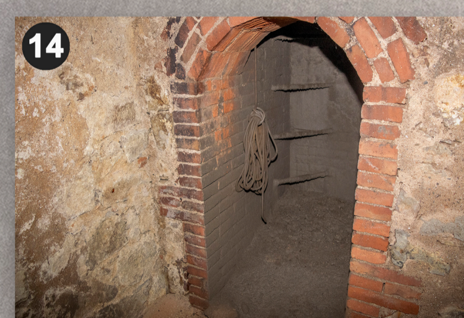
Accés al refugi 0812