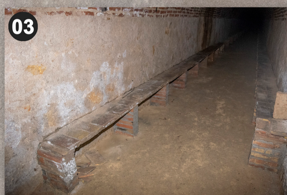
Bancs d'obra per seure