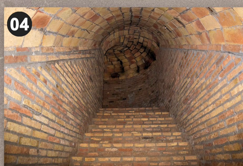
Entrada tapiada (cantonada oest dels carrers València amb Roger de Flor)