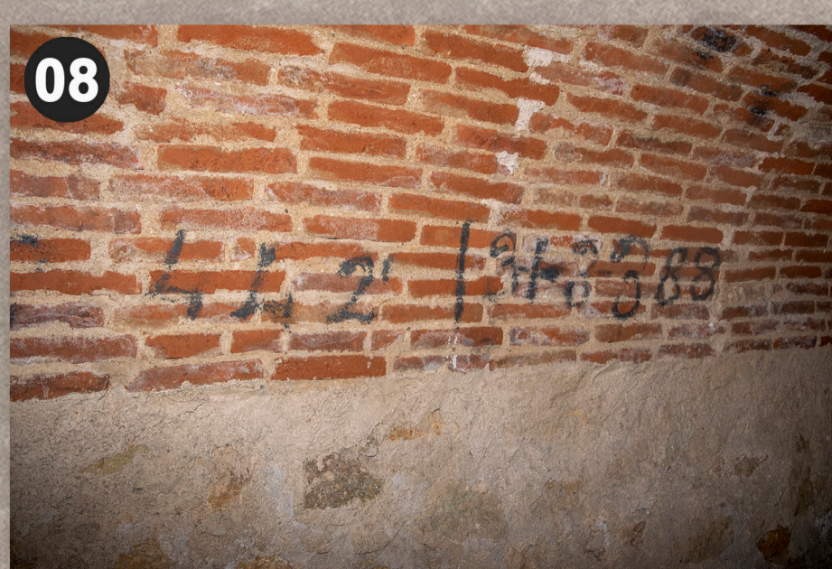
Espai destinat als residents d'aquest bloc de pisos