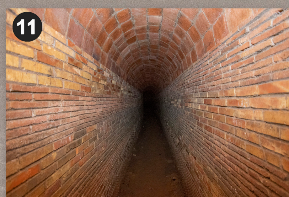
Galeria ramal de volta de mig punt