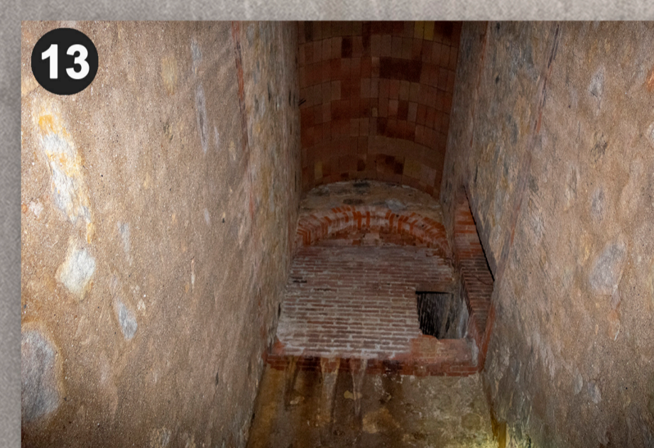
Connexió entre els refugis 0095 i 0812