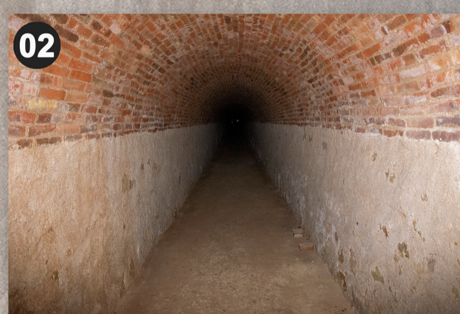
Galeria o túnel de volta de mig punt