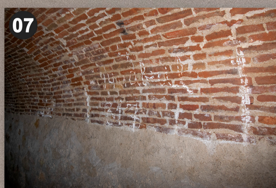
Espai destinat als residents d'aquest bloc de pisos