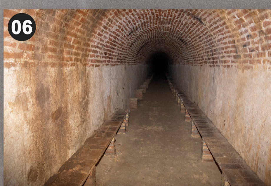
Galeria principal amb bancs