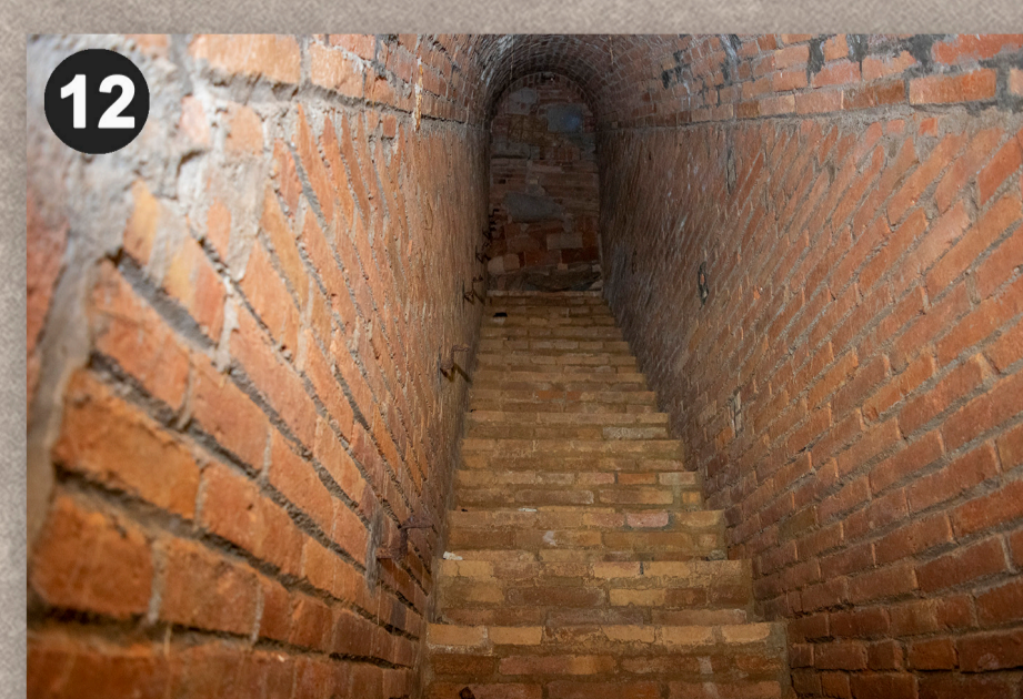
Entrada tapiada (cantonada est de l'Av. Diagonal amb el carrer Nàpols)