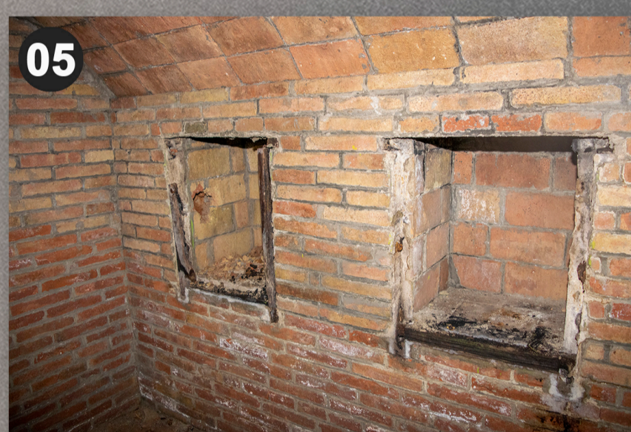
Infermeria amb armaris encastats