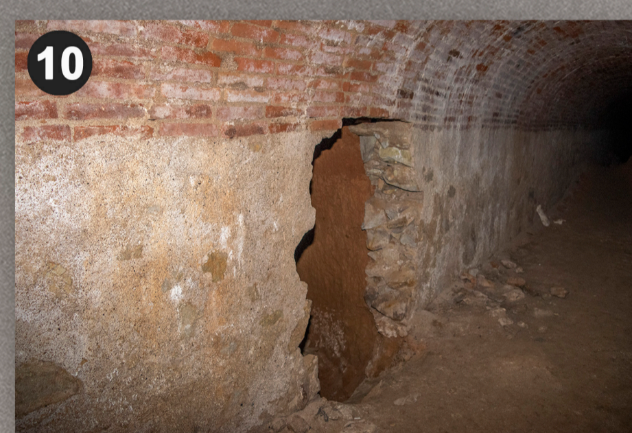
Accés al ramal des de la galeria principal