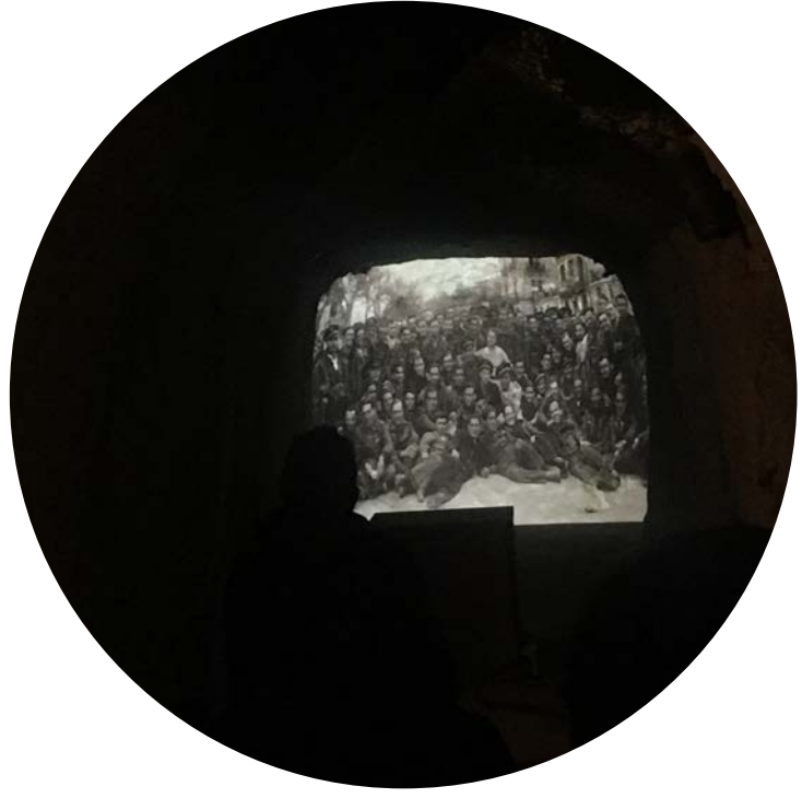
Què va passar entre agost del 38 i gener del 39? Aquí, un petit audiovisual parla de l'acollida de persones refugiades i desplaçades, de l'aeròbrom republicà de Rosanes, de la indústria de guerra instal·lada a la Garriga, de la retirada, del reagrupament de les Brigades Internacionals al poble...