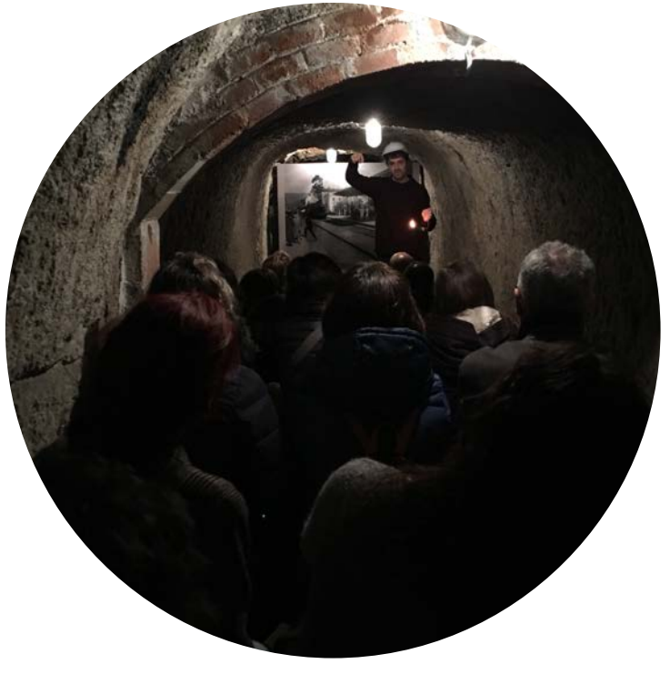
L'última parada se situa l'endemà del bombardeig. Amb la guia il·luminant l'espai amb un llum d'otó, es dona pas a una escena gravada en aquest mateix punt del refugi. Tot el que s'hi explica va succeir el dia 29 de gener de 1939 a la Garriga. I la guia, després, hi posa noms i cognoms.