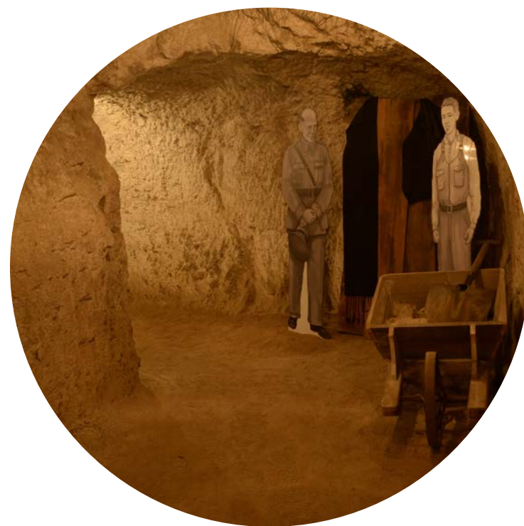
La conversa (fictícia però realista) entre Felipe Vizcarondo i Josep Aguilars serveix d'excusa a la guia per parlar dels esforços de defensa passiva de la Garriga durant el 1938.