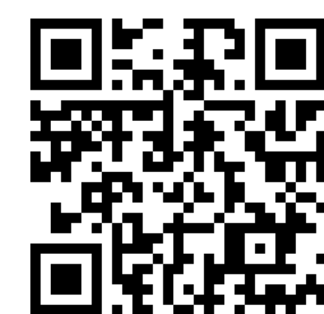
El document "Assolir el bombardeig a la Garriga"