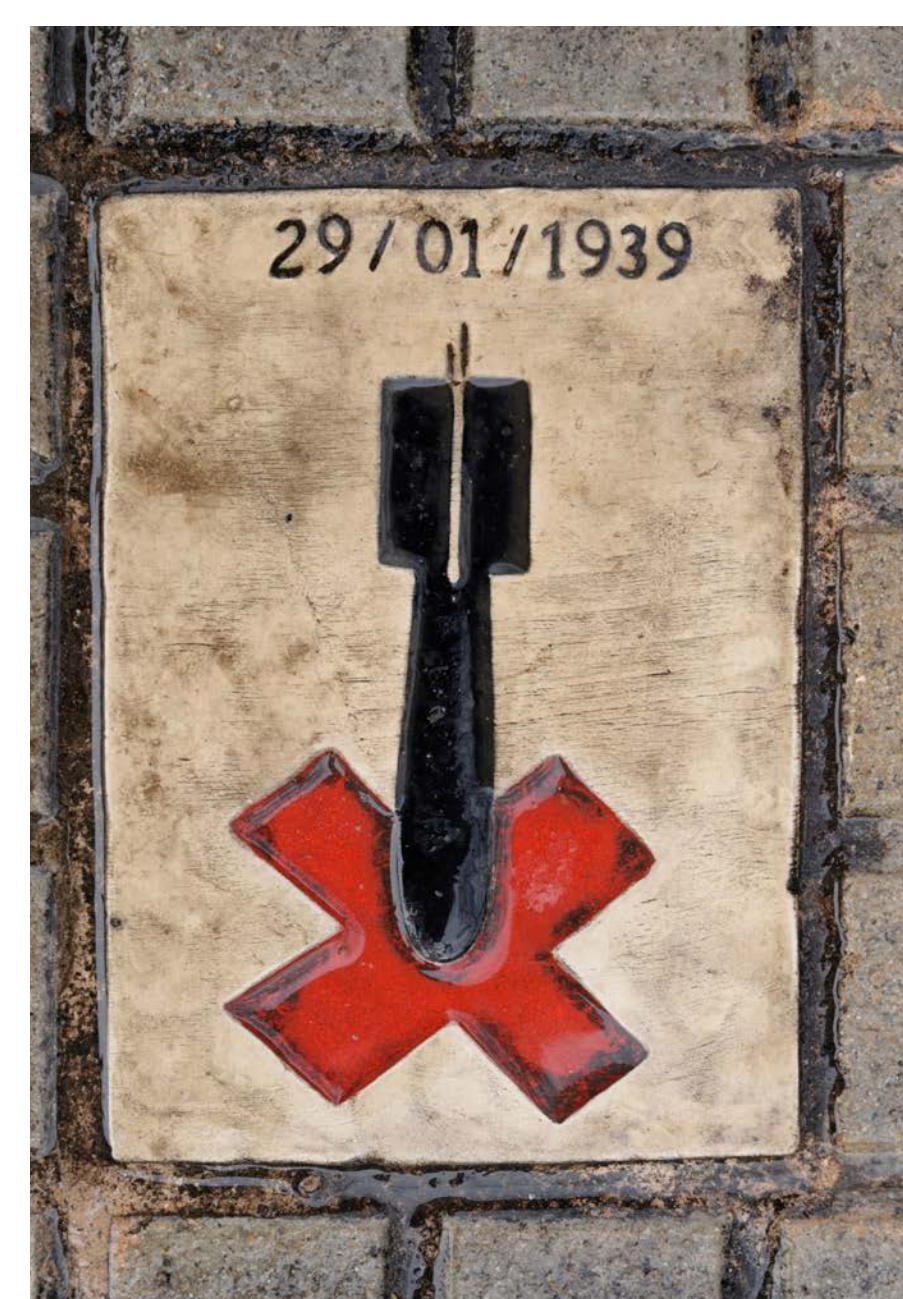
Senyalització dels espais bombardejats.

Pretenem la rigorositat, però no l'equidistància, ni tenir un discurs innocu i blanc. Volem transformar les coses i ajudar a crear persones amb més capacitat crítica i consciència social, també amb la posada en valor del patrimoni i les històries vinculades a la memòria democràtica. No volem ser còmplices o continuadores d'aquella ocultació que va establir la dictadura i que va mantenir, quasi invariablement, la transició.