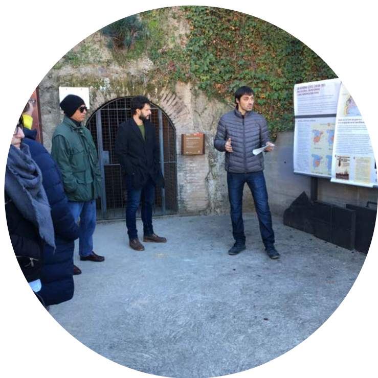
Per a l'inici de la visita s'utilitzen unes línies que es despleguen a sobre d'un dels plafons exteriors.