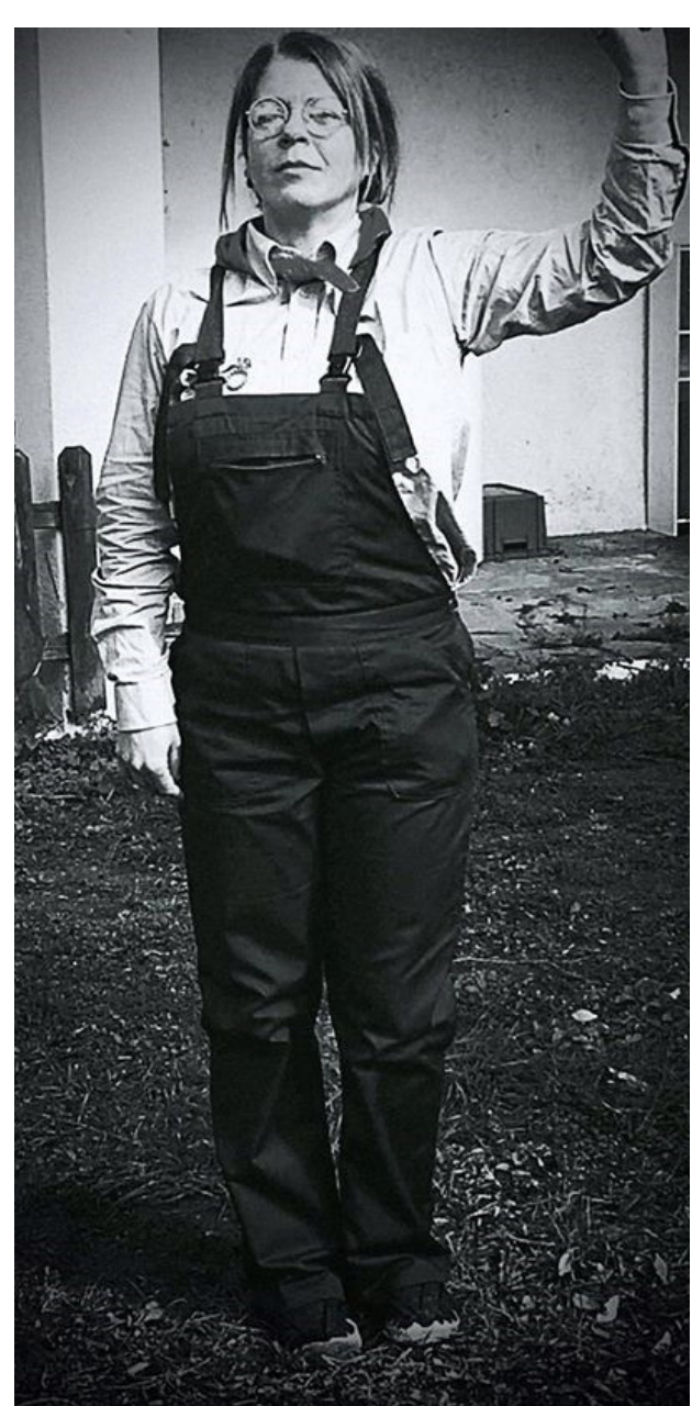
Una miliciana que participa de la visita guiada i teatralitzada "La Garriga, plena de refugiades".

La "comercialització" del patrimoni ha tendit a teixir discursos molt plans, ja fos per inèrcia i desconeixement, perquè es banalitzen les capacitats i voluntats del públic, o per invisibilitzar lectures que no convenien. Això últim ha passat (i segueix passant) amb la història de la República, de la Guerra Civil, del Franquisme.