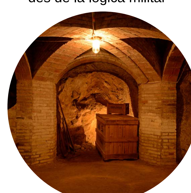
Amb el públic a l'encreuament central de passadissos, un àudio amb la lectura del diari de la unitat italiana que va bombardejar el poble i una simulació de bombardeig vist des de l'interior del refugi serveixen per parlar dels aspectes militars del bombardeig de la Garriga.