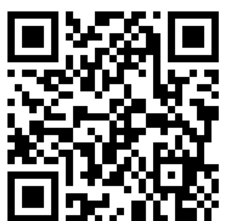
Ruta guiada "La Garriga, plena de refugiades i memòries del bombardeig"