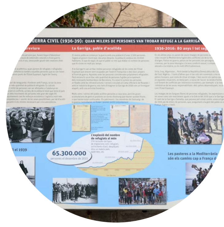
Per tancar la visita, la guia es recolza en la senyalització, reforça el missatge interpretatiu i evidencia que aquesta història tan rellevant ha estat invisibilitzada i silenciada durant quaranta anys de dictadura i bona part de la democràcia.