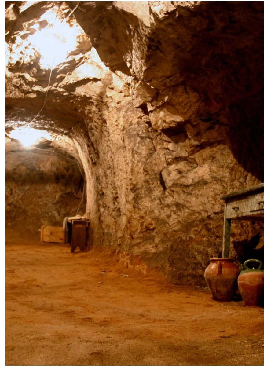
La museografia de l'any 2006.