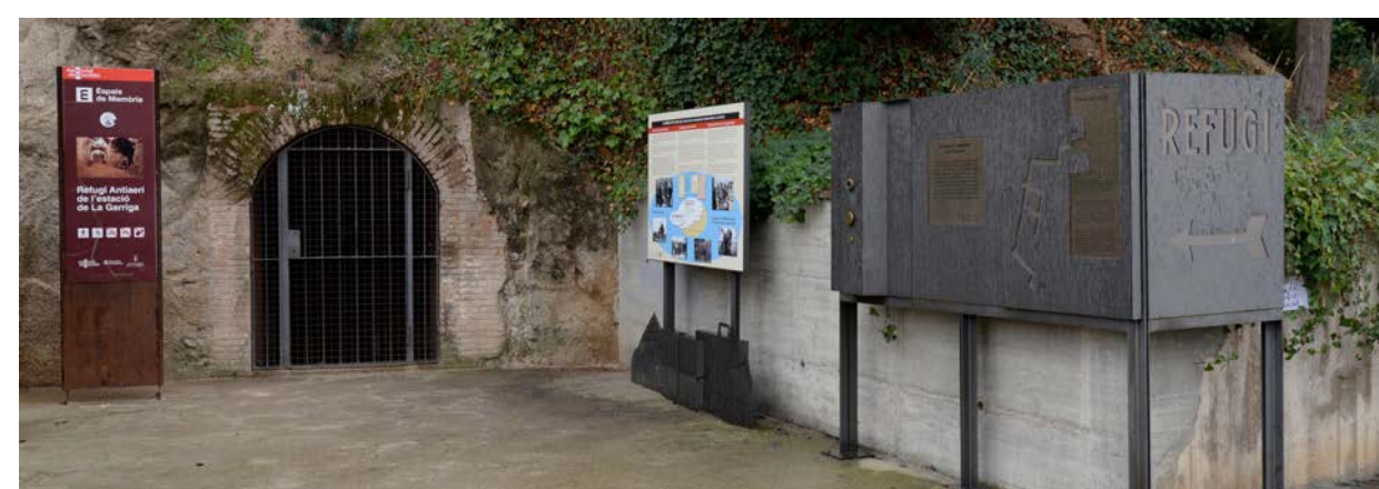
El refugi vist des de l'estació de tren.

Teníem clar que l'important en el projecte era la història i, per descomptat, el mateix refugi, l'espai real on va succeir part de la història i on havia de ser explicada. Per tant, els recursos museogràfics i l'atrezzo havien de ser mínims: simplement eines al servei de la història i de l'espai.