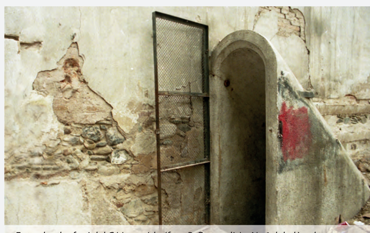
Entrada al refugi del C/ Josep Irla. Nº 6 del plànol

«Qui no faci acte de presència o no treballi en la construcció dels refugis i obres de defensa passiva serà conceptuat enemic de la defensa de la ciutat i sancionat severament»