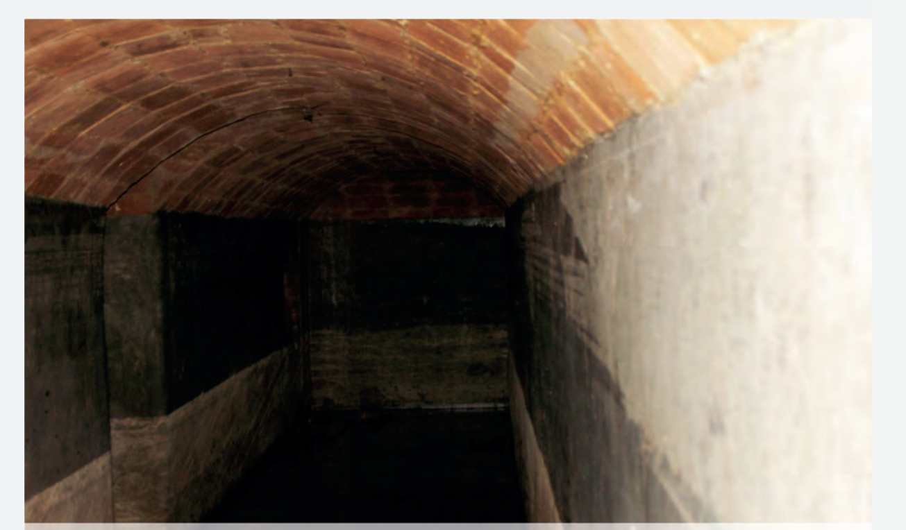
Refugi de la Pl. J. Maluquer - C/ M. Sans - (foto C. Cantarell). Nº 16 del plànol

Documentar, localitzar i adequar refugis perquè es puguin visitar. Incloure'ls en la ruta de la memòria dels bombardejos. Integrar la memòria i el patrimoni memorial en l'urbanisme de la ciutat. Organitzar visites guiades, jornades de portes obertes, activitats amb grups escolars o activitats artístiques. Accions, totes elles, perquè no oblidem que va haver-hi un temps, no tan llunyà, que la nostra ciutat va ser víctima de la violència, que els nostres veïns i les nostres veïnes van haver de buscar refugi per protegir les seves vides dels bombardejos aeris. I que són precisament aquestes persones les qui, amb el seu testimoni, ens transmeten un missatge molt clar: mai més bombes, ni aquí ni enlloc. La violència no pot ser mai la solució als conflictes. Només el diàleg, la paraula, ha de ser l'eina per a resoldre'ls. Treballar la memòria democràtica per construir pau. Aquest és el sentit últim que hi ha darrere els programes recuperació de la memòria històrica i del patrimoni memorial: educar i sensibilitzar en cultura de pau, promoció dels drets humans i enfortiment de la democràcia.