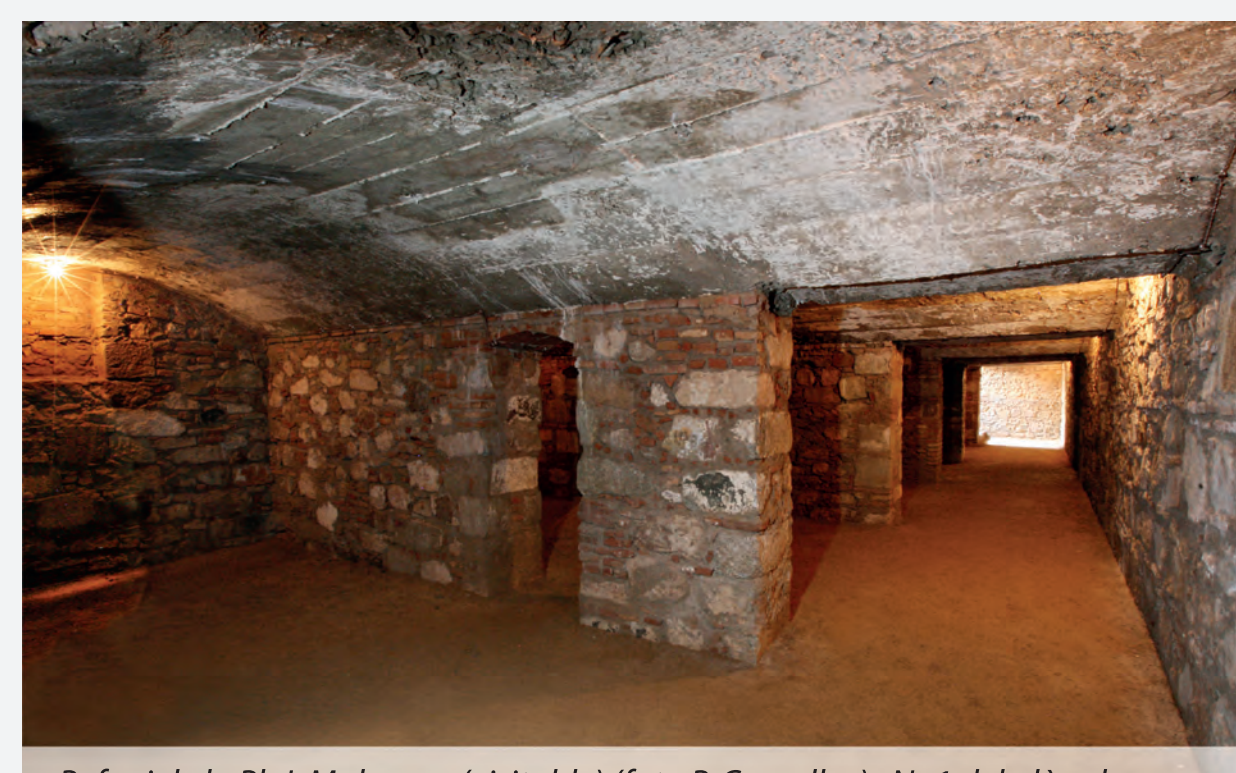
Refugi de la Pl. J. Maluquer (visible). Nº 1 del plànol

Tota aquesta dinàmica constructiva, finalment duta a terme, cristal·litzà en la construcció de 37 refugis coneguts, entre els que comptem 23 refugis d'obra nova o registrats documentalment, als que afegim 14 dels que en tenim constància oral. Aquest llistat es concreta per la documentació conservada, fonamentalment entre juliol de 1938 i gener de 1939, quan acabà la guerra a la ciutat. És a dir, que un període de 6 mesos s'acceleraren i executaren els projectes que llargament havien quedat sense concloure. Tipològicament, tots els refugis que coneixem de nova construcció són de tipus mina-galeria, exceptuant el de la Plaça Maluquer que és de tipus cel·lular. Aquesta aclaparadora diferència rau fonamentalment tant en els costos com en el temps d'execució de l'obra.