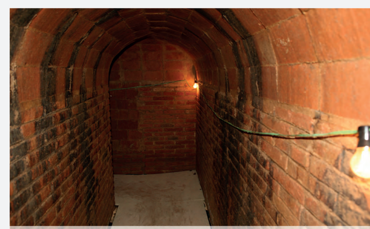
Refugi de l'Ajuntament (visible). Nº 2 del plànol

En el marc de la commemoració del 70è aniversari del bombardeig de 1938 s'inaugurà Can Jonch. Centre de Cultura per la Pau, l'any 2008. Prenent com a punt de partida que les ciutats que han patit bombardejos han de ser la força que lideri els moviments per a la consecució de la pau, Granollers ha fet una aposta estratègica cap a la sensibilització i el foment de la cultura de la pau, amb la posada en marxa de Can Jonch.