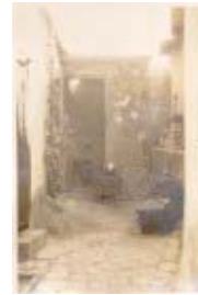
Document 53 Document 56