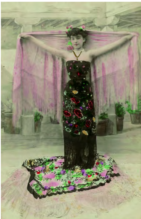
Artista folclòrica, 1900-1910.

Acolorir fotografies. Aquesta va ser una tècnica molt utilitzada en el retrat quan encara no existia la fotografia en color, el llarg del segle XIX, i principis del XX, algunes fotografies s'acolorien a mà, amb aquarel·les, oli, anilines, o altres pigments. Però aquest acolorit manual era artístic i no tècnicament fotogràfic. Ja en l'època del daguerreotip es van començar a acolorir els retrats, pagant un suplement. Els estudis de fotografia donaven aquest servei, per tal d'aportar més realisme a la fotografia.