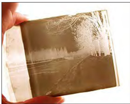
Placa de vidre en negatiu