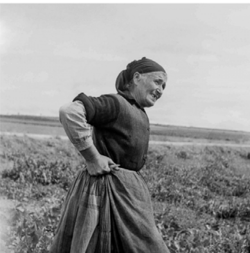
Pagesa entre vinyes al camí de Madrid cap a Alcalá de Henares, 1937. Kati Horna. Centro Documental de la Memoria Histórica.

En l'àmbit narratiu: què ens està explicant la fotografia? Veure el que se'ns vol fer arribar i el que en realitat ens arriba. Analitzar aquesta història en l'àmbit expressiu: té força? Té valor per si mateixa o hi ha altres elements que donen valor a la imatge com, per exemple, la composició? Analitzarem l'actitud dels personatges... És tan important el que mostren les imatges com el que amaguen.