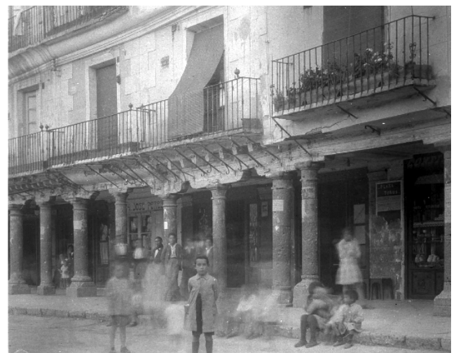
Detall de la fotografia: Toro (Zamora). Plaça Major. 20 de setembre de 1927.