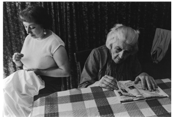
Escena domèstica, 1969. AFB. Carme Riera

En l'àmbit narratiu: què ens està explicant la fotografia? Veure el que se'ns vol fer arribar i el que en realitat ens arriba. Analitzar aquesta història en l'àmbit expressiu: té força? Té valor per si mateixa o hi ha altres elements que donen valor a la imatge com, per exemple, la composició? Analitzarem l'actitud dels personatges... És tan important el que mostren les imatges com el que amaguen.