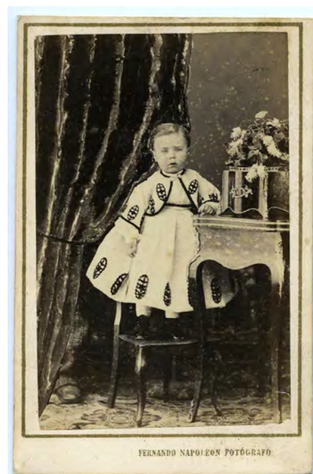
Retrat de nen. Targeta de visita. Abans de 1869. AFB. Paper a l'albúmina. Estudi Napoleon.