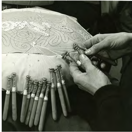
Puntaire. Col·lecció Oficis artesans de la ciutat.

En l'àmbit tècnic: com s'han utilitzat els elements tècnics fotogràfics en la imatge?