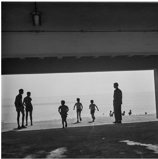
La Barceloneta 1956.

D'una banda, podem analitzar els elements escalars: la profunditat, la perspectiva, la proporció, l'articulació del punt de vista. Així com els elements dinàmics: el ritme, les línies, les diagonals, les fugues. D'altra banda, en aquest nivell analitzarem també com s'articulen l'espai i el temps de la representació. Ens explica, doncs, alguna cosa la composició?