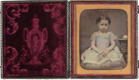
Retrat de nena, 1842-1860.

El daguerreotip és un procés pel qual s'obté una imatge en positiu a partir d'una placa de coure recoberta de iodur de plata. ... El daguerreotip o daguerreotip va ser el primer procés fotogràfic d'aplicació pràctica, presentat per François Arago en l'Acadèmia de Ciències de París el 19 d'agost de 1839.