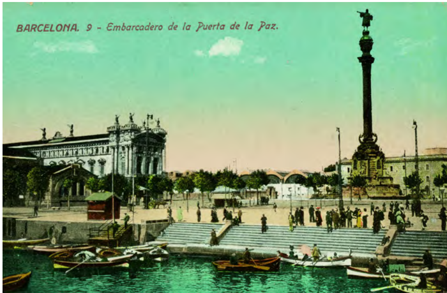
Port, 1905-1915.