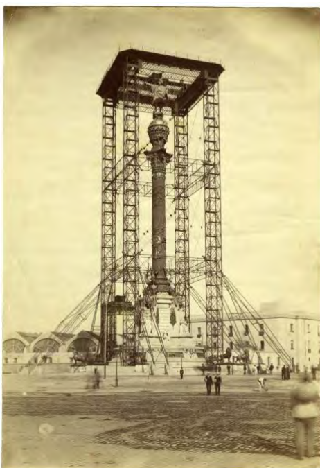
Monument a Cristòfol Colom, 1887. AFB. Antoni Esplugas.

Tècnica fotogràfica d'impressió de positiu per contacte directe, tècnica que consisteix en la impressió de la imatge per llum ultraviolada (sol) sense revelat químic, molt comú durant la segona meitat del segle XIX, que consistia en un full de paper recobert per dues o més capes de clara d'ou a manera de vernís, el qual podia ser algunes vegades brillant. Posteriorment era fotosensibilitzat amb un bany de nitrat de plata per a formar amb el clor contingut en la solució d'albúmina, sals de clorur de plata (sal fotosensible). L'elevada presència d'aquest procés a l'Arxiu es fonamenta en el fet que protagonitza gairebé tota la producció fotogràfica sobre paper entre 1850 i 1890.