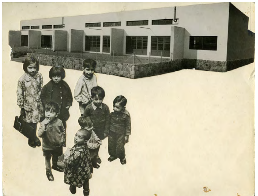
"La lucha contra el analfabetismo", 1936. AFB. Margaret Michaelis