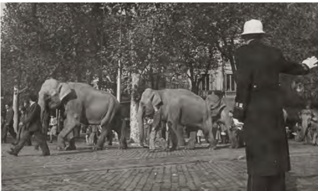
Elefants d'un circ al seu pas per la ciutat, 16 de novembre 1945.

En l'àmbit contextual: en quin moment i entorn s'ha copsat la imatge? Saber-ho ens ajudarà a interpretar-la, recollir informació sobre l'autor, el moment històric de la imatge, entendre el context social, cultural i polític de l'època.