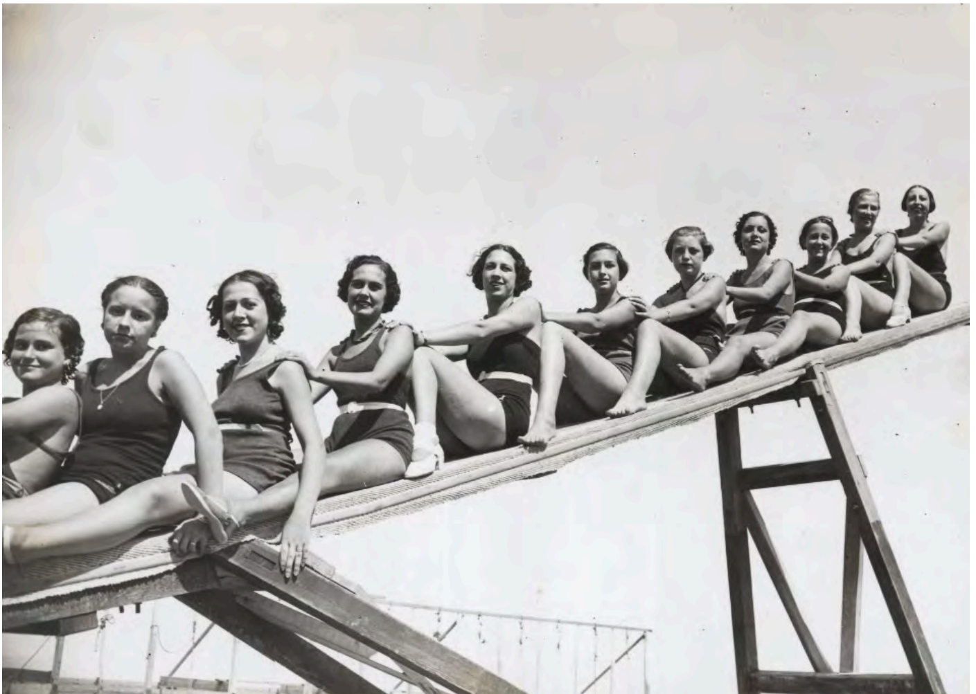
Nedadores, 1934.

MATERIAL EDUCATIU entorn la fotografia d'arxiu