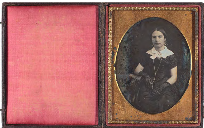
Daguerrotyp. Retrat de dona, 1842-1860.

La imatge et sembla correctament exposada (és massa fosca, massa clara)? La profunditat de camp (està tot enfocat o hi ha una part de la imatge desenfocada), la velocitat d'obturació (el moviment està congelat o la imatge està borrosa a causa del moviment), és en color o en blanc i negre? Si els paràmetres esmentats no són els que haurien de ser, per què? Quina és la tècnica fotogràfica utilitzada, i a quin moment històric pertany?