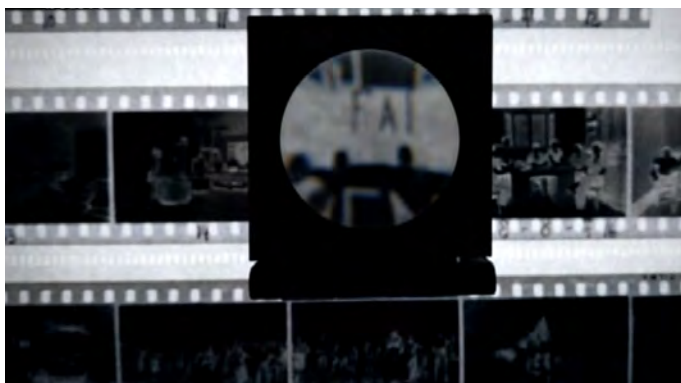
Pel·lícula negativa en blanc i negre

Sigui a color o en blanc i negre, representa l'escena fotografiada en transparent i amb els tons invertits. Per a obtenir l'escena real s'ha de processar el negatiu i positivar-ne les còpies, que coneixem com a fotografies. La pel·lícula està formada per una base que suporta una capa fotosensible.