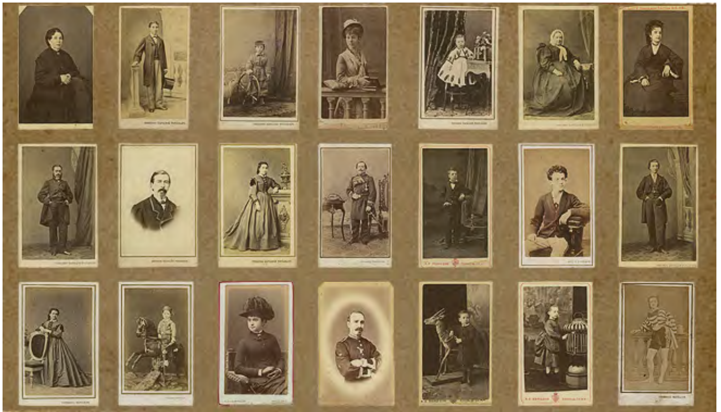
Targetes de visita. Estudi Napoleón. Segona meitat del segle XIX i primers anys del XX.