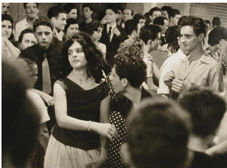
Jordi Munt Farré. Sense títol, s/d. Dipòsit de l'AFC al MNAC

L'autenticitat també és clau en la trajectòria de les sòcies integrants del Grup Femení de l'Agrupació Fotogràfica de Catalunya, que establiren una relació directa amb la vida que les envoltava, moltes vegades dones i nens en la seva quotidianitat. També en aquest cas anaren més enllà de les convencions, oblidaren les crítiques que volien limitar-les a una pretesa femineïtat i aconseguiren trobar un camí propi. La seva tasca pionera ha estat reconeguda amb el temps i s'ha constituït en font d'inspiració per a les noves generacions.