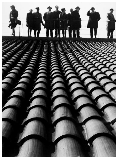
Carme Garcia Padrosa. Sense títol, s/d. Fons AFC

L'Arxiu Fotogràfic de Barcelona contribueix a la celebració del centenari de l'Agrupació Fotogràfica de Catalunya amb aquesta exposició.