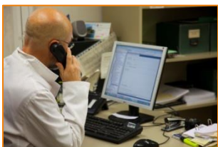
AMDSM, juliol del 2016