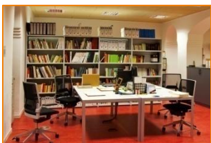
AMDSM, juliol del 2016

2. Escribeu el nom de la sala de cada fotografia. Relaciona la sala amb la seva funció.