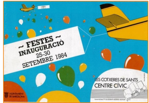
Programa festes inauguració cotxeres de Sants AMDSM, 1984