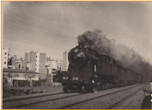
Tren Vapor, UEC Sants, 1929

3. Escriu a sota de cada imatge quin tipus de document és: