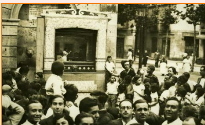
Plaça de la Vila. 1931. Autor desconegut. AMDG