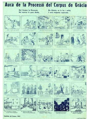
Auca de la Processó de Corpus de Gràcia. 1947. AMDG