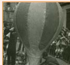
Activitat infantil. 1948-50. Joan Ramírez Sagarra. AMDG