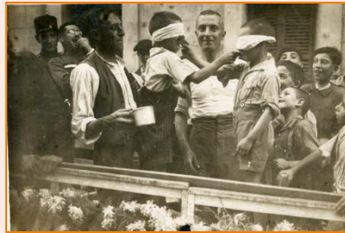
Activitat infantil. 1925.