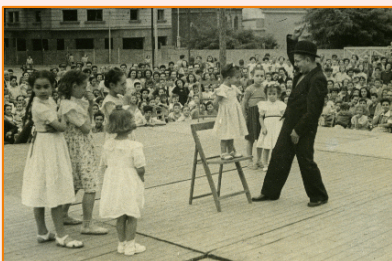
Festival infantil. 1948-50. Joan Ramírez Sagarra. AMDG