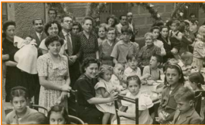
Activitat per als infants. 1946. Kim. AMDG