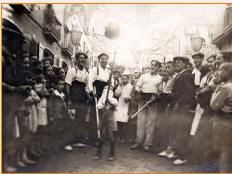
Trencant l'olla. 1925. Autor desconegut.