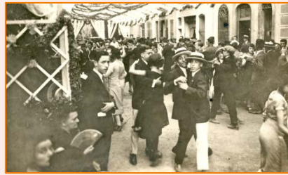
Activitat per a tothom. 1925. Autor desconegut. AMDG