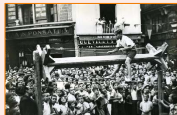
Sant Roc a la plaça Nova. 1935.