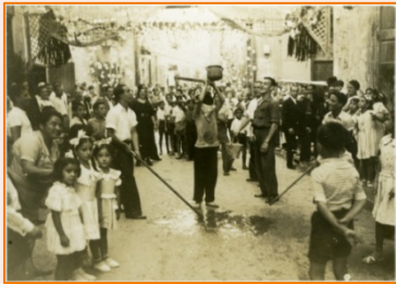
Carrer de les Torres. 1935. Pau Jarque. AMDG

7. A partir dels programes i de les definicions, posa el nom a les activitats que es feien per als infants durant la Festa Major de Gràcia.