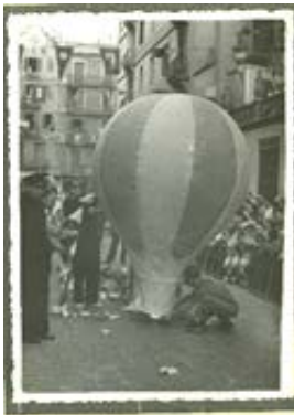
Enlairament de globus a la Rambla del Prat. 1948-50. Joan Ramirez Sagarra. AMDG

3. Escriu a sota de cada imatge quin tipus de document és: