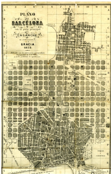
Plànol de Barcelona i Gràcia. 1873. AMDG.