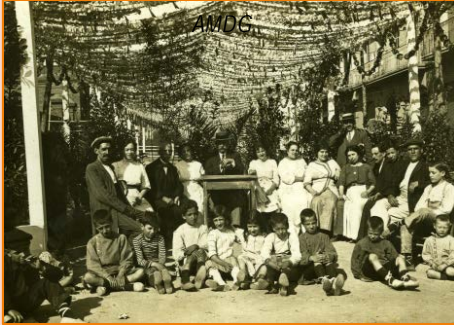
Grup de veïns al carrer d'Antoni M. Claret. 1920-30.