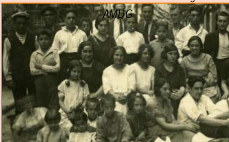
Grup de veïns. 1923.