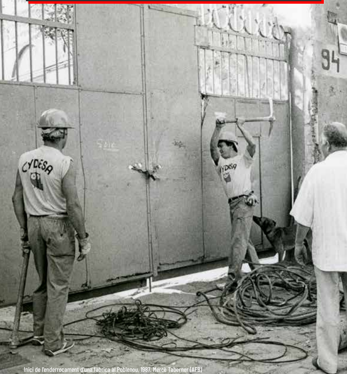
Inici de l'enderrocament d'una fàbrica al Poblenou, 1987.