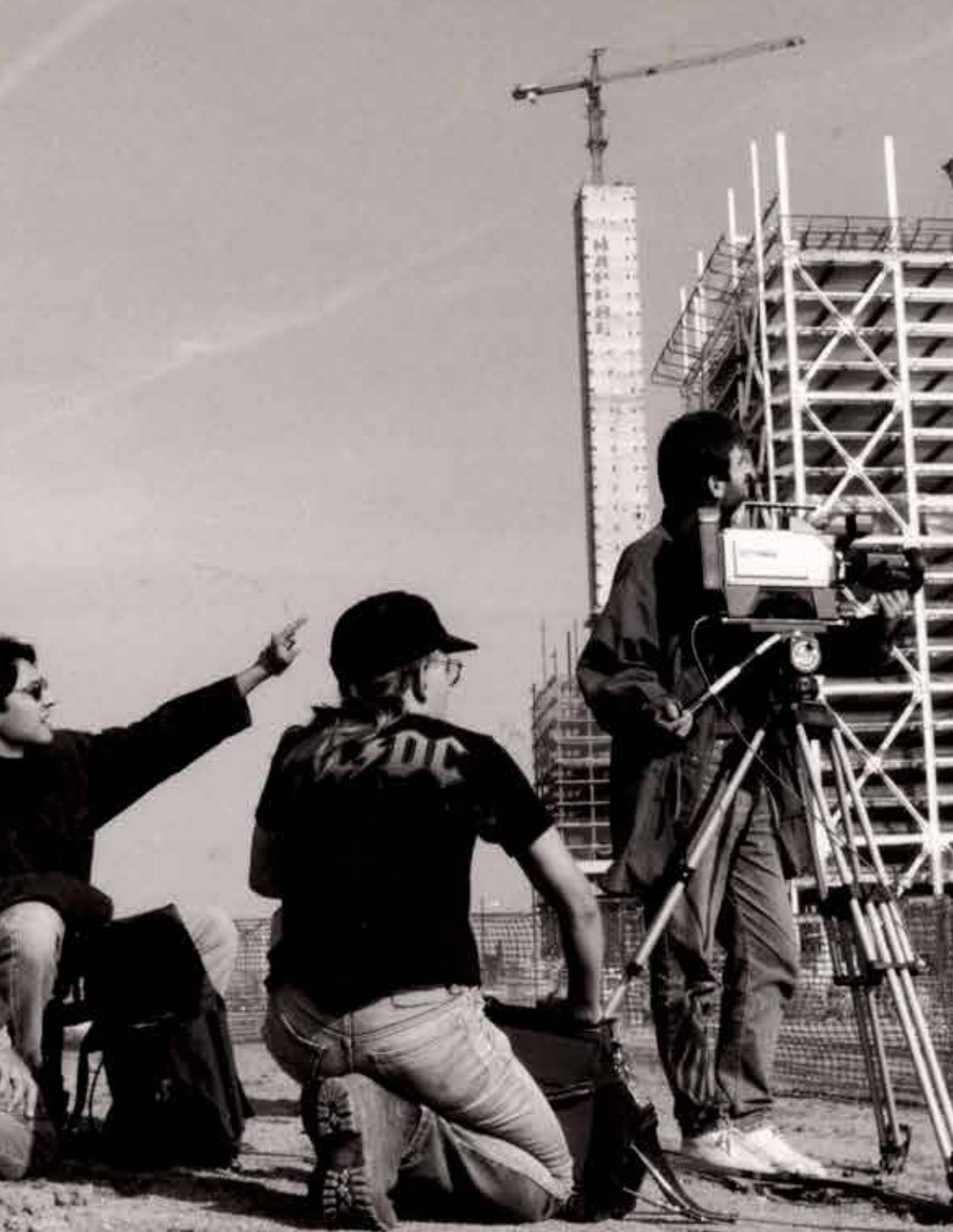
L'equip de Clara Films en acció durant la construcció de les Torres Mapfre, (s.d.). (Clara Films)