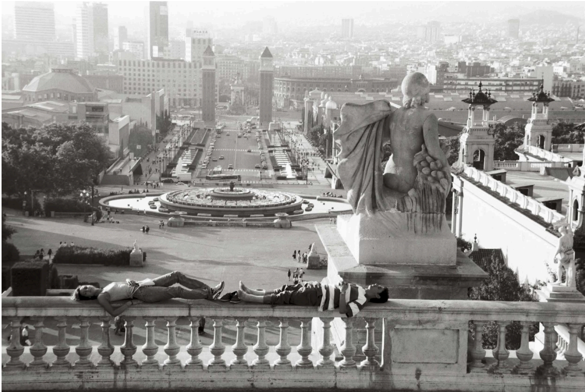
COLITA, 1997 Montjuïc

En definitiva, cada una de las fotografías que componen el libro no solo inmortaliza un instante, sino que revela las múltiples facetas de una ciudad cosmopolita, viva y en constante transformación.