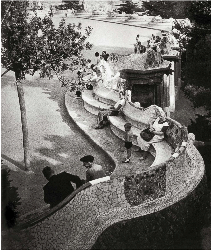
Park Güell