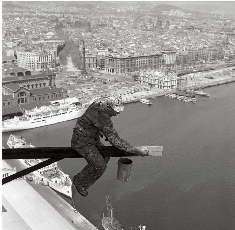
AUTOR DESCONOCIDO, 1962. Un obrero trabaja en la restauración del teleférico de Jaume I, en el puerto de Barcelona.

En “La génesis del cambio”, que recoge el periodo entre 1969 y 1991, se concentran algunos de los momentos más convulsos de la historia reciente de Barcelona, como las manifestaciones a favor de la amnistía tras la muerte de Franco, recogidas por la cámara de Colita, o el nacimiento del movimiento feminista, retratado por Pilar Aymerich. En esta sección encontramos también las primeras imágenes en color del libro de Francesc Català-Roca.