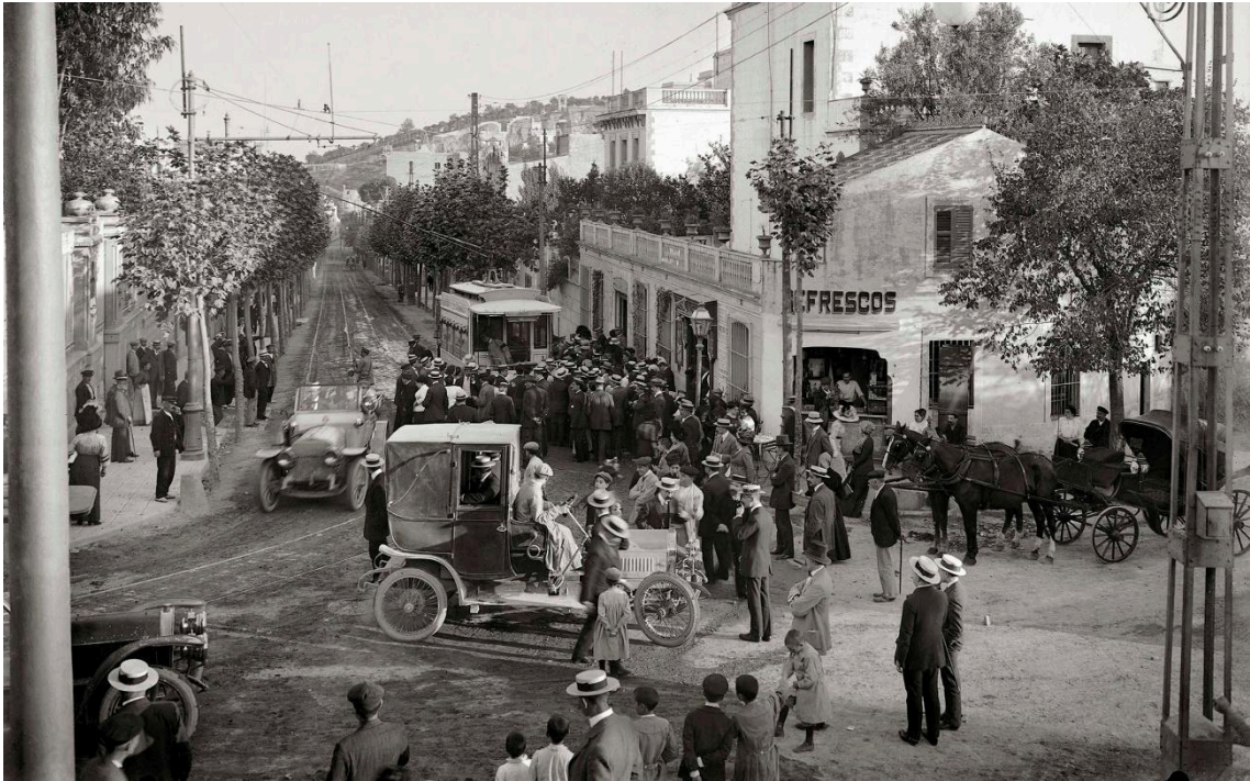
AUTOR DESCONOCIDO, 1911. Tranvía de la Arrabassada, Sant Cugat del Vallès.

Organizado cronológicamente en cinco capítulos, el libro invita al lector a redescubrir Barcelona desde sus inicios como "La ciudad de los prodigios" hasta convertirse en un referente global en "El salto al futuro". Cada sección ayuda a conocer la ciudad desde perspectivas tan diversas como las manifestaciones de la Segunda República, las escenas urbanas de la posguerra o los icónicos Juegos Olímpicos de 1992, hasta llegar a la vibrante Barcelona contemporánea.