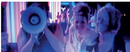
Espai Avinyó - Llengua i Cultura (c. Avinyó, 52)