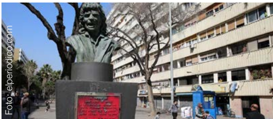
Ens trobarem a l'Arxiu Històric de La Mina (c. Orient, 15. Sant Adrià del Besòs)