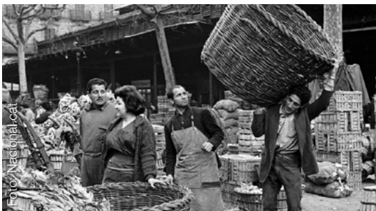
Centre Cívic Pati Llimona (carrer Regomir, 3)