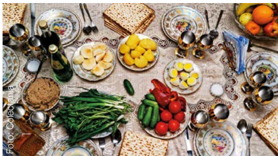
Casa Adret (c. Salomó Ben Adret, 6)