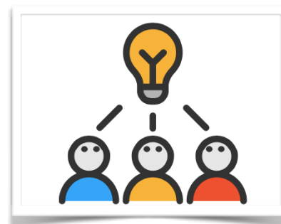
Creadores del proyecto

Envía un mail al coordinador sandarumetraj@gmail.com con tu rol: director, actor, guionista; y el equipo técnico que puedes traer