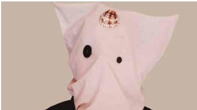
Fotografia de la companyia