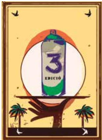
Imatge de Digerible

Una mostra d'artistes establerts a Barcelona amb estils i formes d'entendre l'art molt diferents. Del mur al llenç, de l'exterior a l'interior i el carrer com a espai vital per desenvolupar la seva obra són els denominadors comuns de l'exposició.