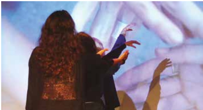
Fotografia del Centre Cívic Barceloneta

Tallers gratuïts per a dones de la Barceloneta. Places limitades Inscripcions: a la recepció del centre cívic. Apunta-t'hi a partir del 23 de març!