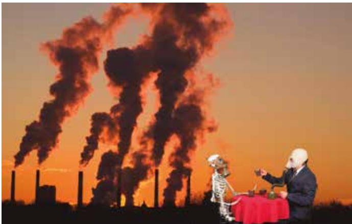
Fotografia de la Manté

Exposició temàtica que realitzen els alumnes de DateCuenta, amb relació a l'emergència climàtica. Per evitar la destrucció del planeta s'ha de treballar en comunitat i transformar la nostra forma de pensar i de viure com a societat. Som el planeta que som capaços de salvar.