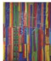
Imatge Col·lectiu Pauta