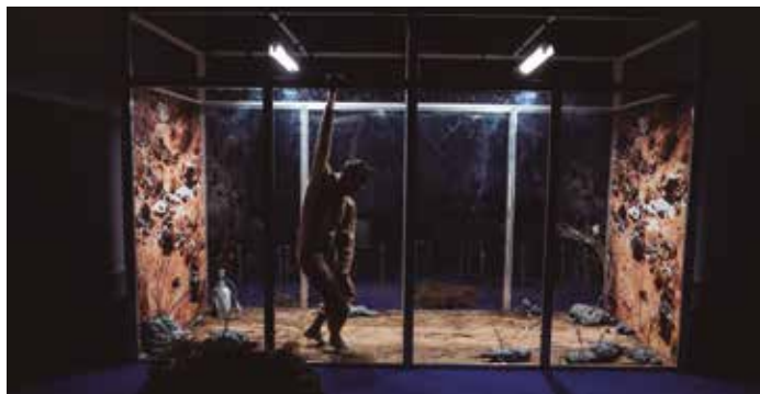
Fotografia de Daniel Biele