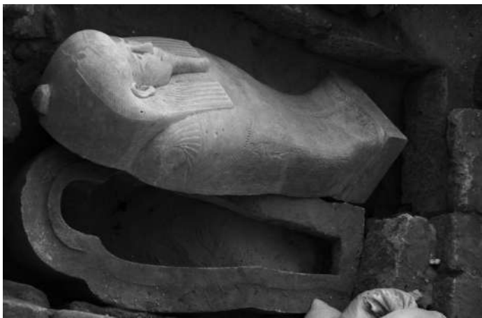
Fotografia: sarcòfag_nou OXI