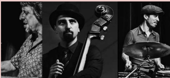
Fotografia: Poyo Blues Trio

Gènere: Gospel, Jazz, Blues, Boogie, Swing, Funk & Groove. Activitat gratuïta amb aforament limitat.