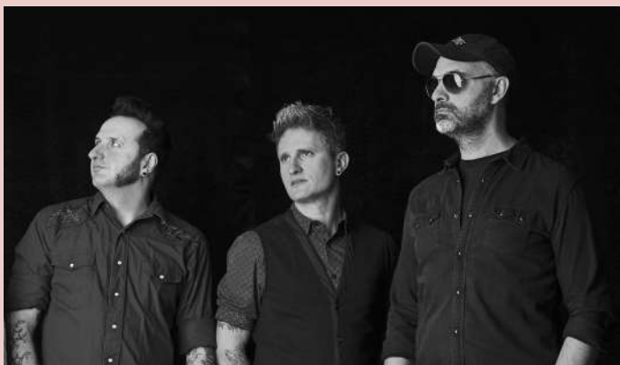
Fotografia: White Line Fever Band

Activitat gratuïta amb aforament limitat.