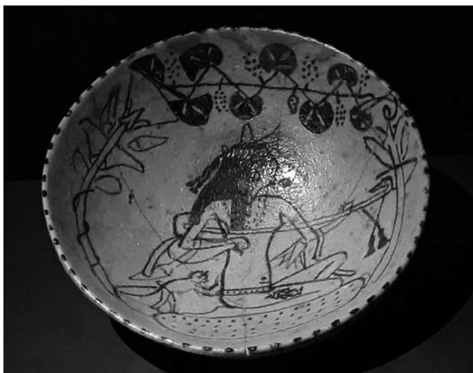
Fotografia: Antic Egipte

Cal inscripció prèvia a través de la web. Activitat gratuïta amb aforament limitat