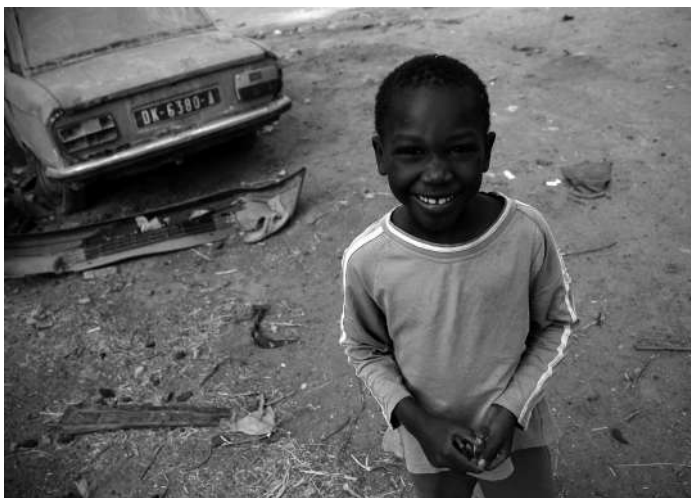
Fotografia: L'Àfrica Esclava

També coneixerem el seu tràgic passat amb el comerç d'esclaus, una pràctica que els europeus van instaurar el segle XV sent l'illa senegalesa de Gorée, lloc estratègic on 's'emmagatzemaven' els esclaus capturats abans de portar-los a Amèrica.