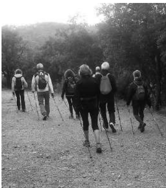
foto: Nordic Walking

Activa't, socialitza i gaudeix de la teva ciutat! Acosta't a aquesta activitat física moderada i saludable per millorar la salut, adequada per tota les edats. La primera sessió serà en el Centre Cívic. Cal dur els pals per l'activitat.