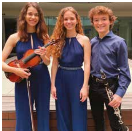
Fotografia: Trio Kórena